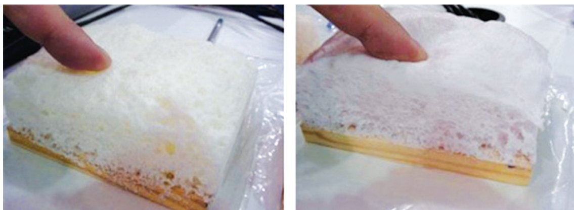
Рис. 3.1. «Зелений поліуретан» тверда та пружна форма

Прозорі наногелі (аерогелі) , відкриті Семюелем Кістлером в Тихоокеанському коледжі (College of the Pacific) в Стоктоні, Каліфорнія, США, що у 1931 році опублікував свої результати у журналі Nature.