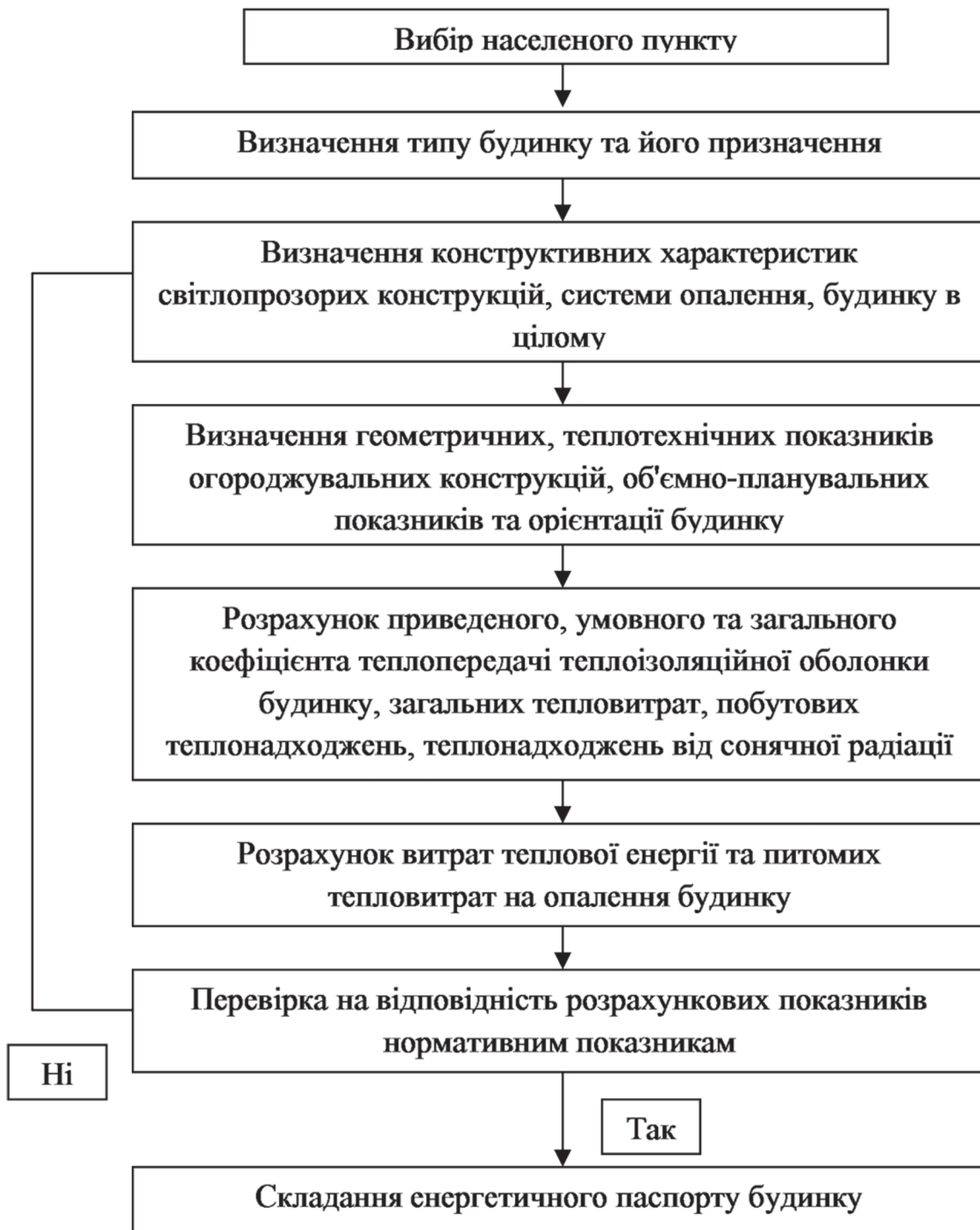
Рис. 5.3. Алгоритм визначення розрахункових параметрів та складання енергетичного паспорту [7]