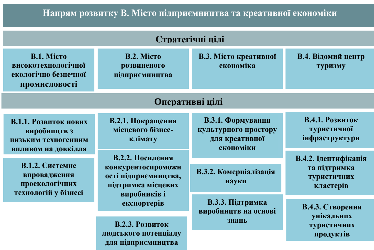
Рис. 5. Структура стратегічних і оперативних цілей за напрямом розвитку В. Місто підприємництва та креативної економіки