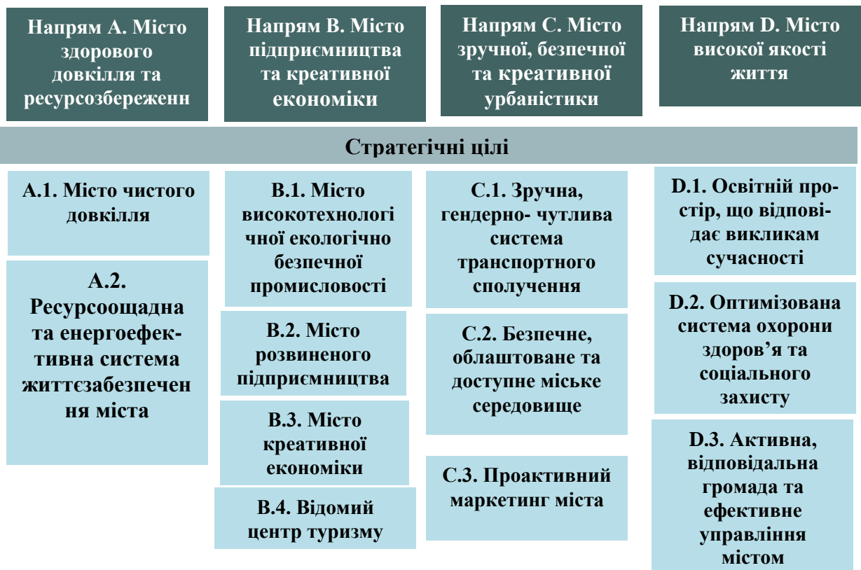
Рис. 3. Структура стратегічних напрямів і цілей Стратегії

Обрані стратегічні напрями взаємопов'язані між собою і визначають основні сфери функціонування громади в цілому, на яких необхідно концентрувати зусилля для досягнення позитивних результатів розвитку, захисту та відродження довкілля міста, підвищення конкурентоспроможності у боротьбі за інвестиції, нові робочі місця, трудові ресурси, податкові