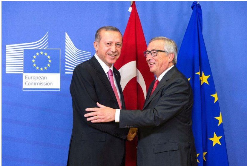
Ресер Таууір Erdoğan & Jean-Claude Juncker

Формально у ЄС є багато питань до Туреччини щодо дотримання прав людини, свободи слова, реформи урядування,