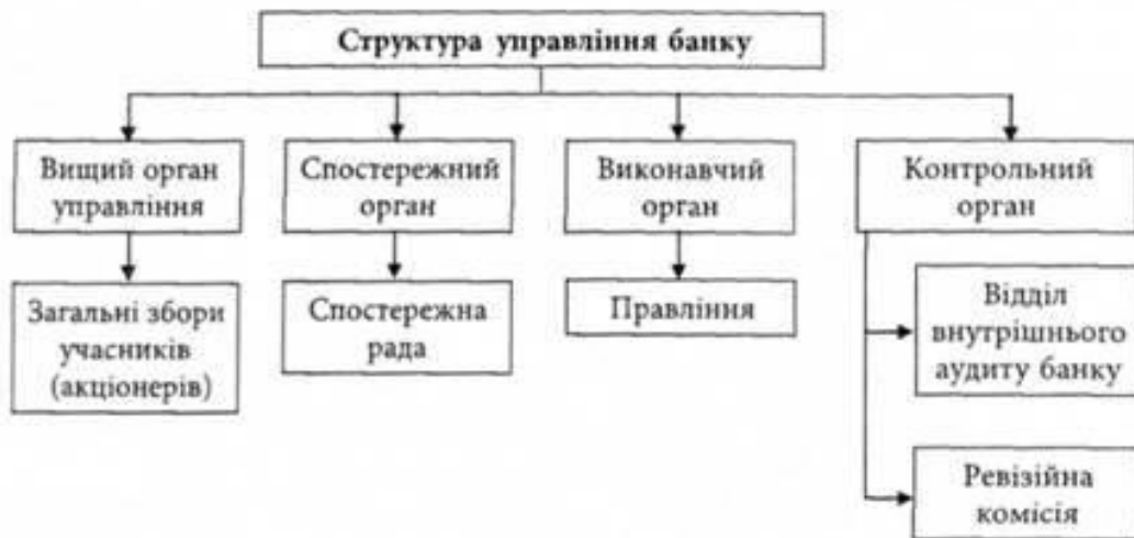
Рис. 4.1. – Структура органів управління банківської установи з колективною формою власності

Компетенції органів управління визначено статтями 38,39,40,41 Закону України "Про банки і банківську діяльність".