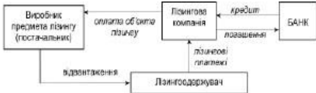
Рисунок 1 – Специфіка лізингових відносин

Зміст та послідовність лізингової угоди приведені на рисунку: