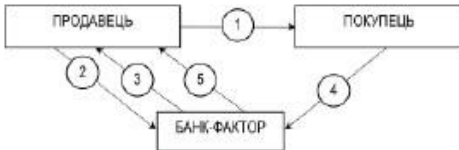
Рисунок 2 – Послідовність здійснення факторингової операції

Зміст та послідовність факторингової операції приведена на рисунку.