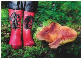
Bolet des pins géant.