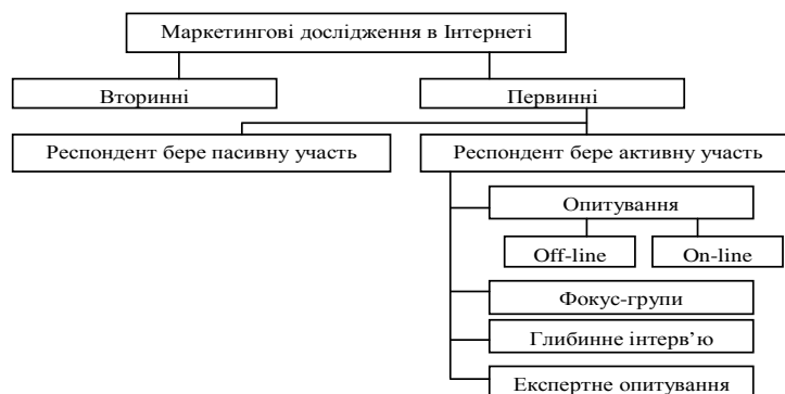
Рисунок 2 – Система маркетингових інтернет-досліджень

Узагальнення викладеного подане на рис. 2 у вигляді структури маркетингових досліджень у середовищі Інтернет.