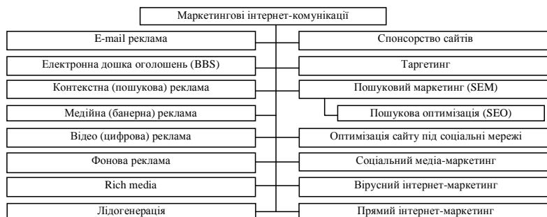
Рисунок 3 – Система маркетингових інтернет-комунікацій

Система заходів маркетингових комунікацій у середовищі Інтернету подана автором на рис. 3.