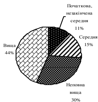
Рисунок 6 – Структура користувачів Інтернету за рівнем освіти

Таким чином, аудиторія користувачів Інтернету становить значну частину населення України, причому найбільш активну й освічену, яка, однак, нерівномірно розподілена між регіонами країни. Статистика свідчить, що розміри вітчизняної інтернет-аудиторії стрімко зростають. Таким чином, потенційні можливості застосування сучасних технологій та інструментів інтернет-маркетингу в Україні є досить значними.