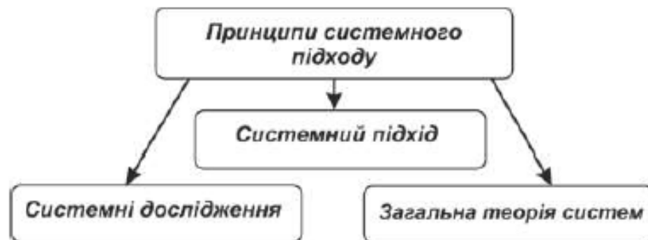
Рис.3. Принципи системного підходу

У змінній людиною частини біосфери - біотехносфері - важливе місце займають екосистеми, що вимагають науково обґрунтованого управління, сформованого на принципах системного підходу: системні дослідження, системний підхід і загальна теорія систем (рис. 3).