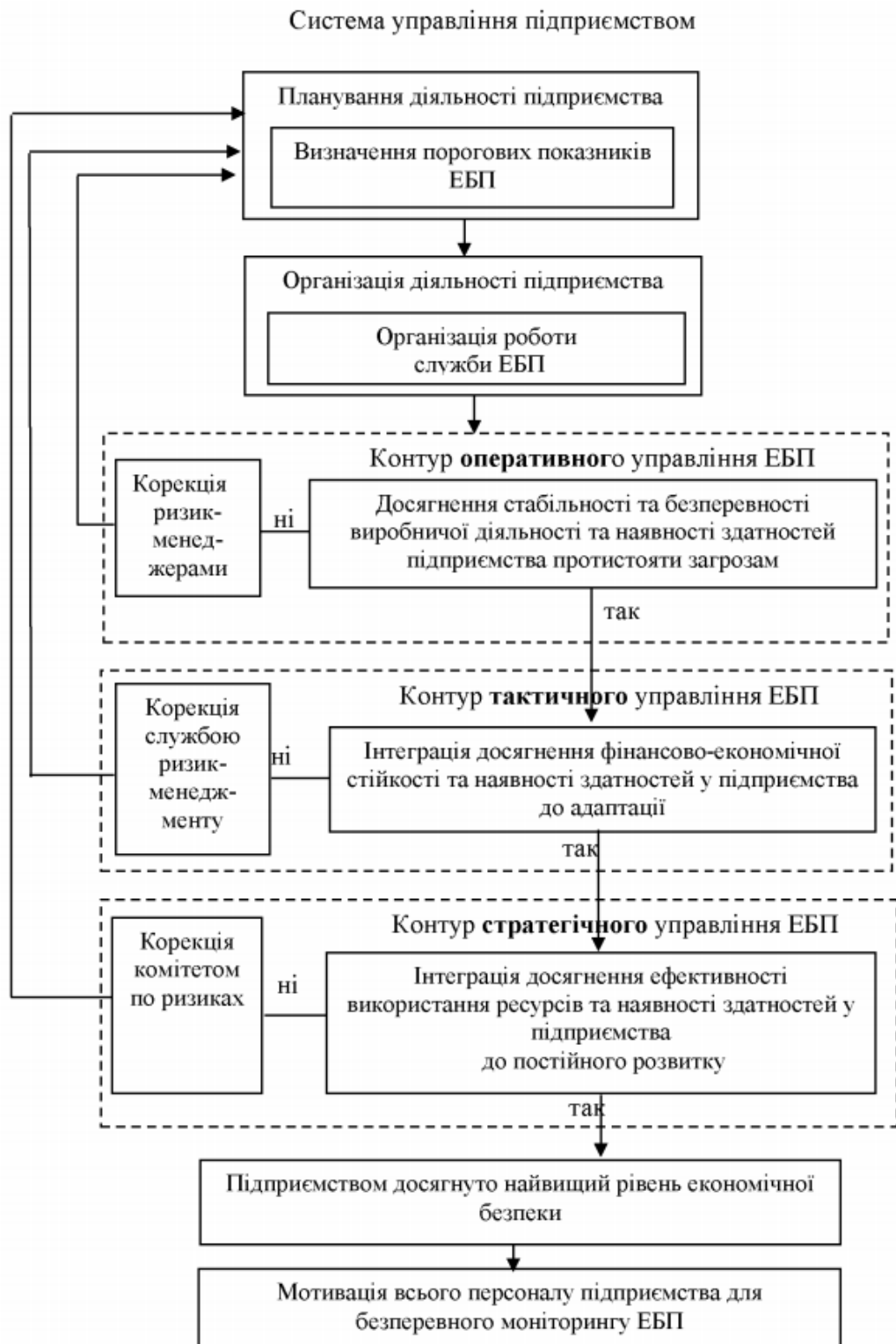
Рис. 7. Місце підсистеми управління економічною безпекою підприємства в системі його стратегічного управління