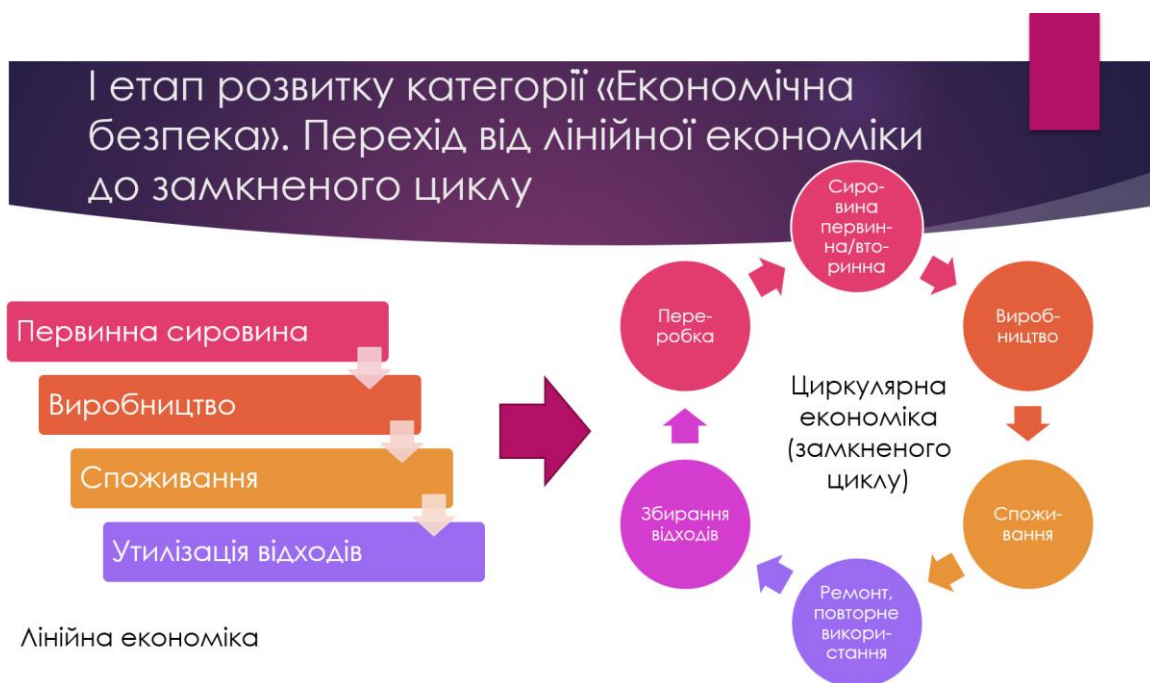
Рис. 1. Перехід від лінійної економіки до економіки замкненого циклу

Поняття «економічної безпеки» пройшло чимало трансформацій у зв'язку зі зміною умов зовнішнього середовища й розвитку суспільства в глобальному вимірі. Вперше поняття «економічна безпека» почало застосовуватись на Заході з середини ХХ ст. у зв'язку зі зростанням проблеми обмеженості ресурсів. Тоді сутність економічної безпеки полягала в забезпеченні державою сталого економічного розвитку, рис. 1.