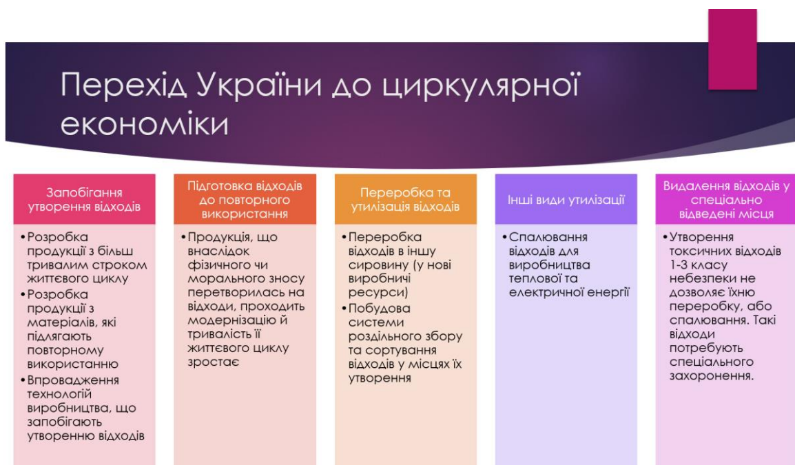
Рис. 2. Зобов'язання України перед країнами ЄС

Яким чином Україна долучається до цього процесу? У 2014 р. набула чинності Угода про асоціацію між Україною та ЄС. Згідно неї, Україна взяла на себе зобов'язання щодо приведення національної нормативно-правової бази до Європейських стандартів управління відходами, рис. 2.