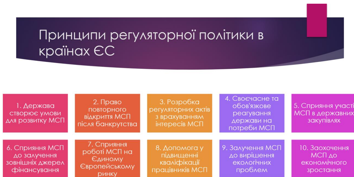
Рис. 5. Принципи регуляторної політики в країнах ЄС

Принципи регуляторної політики в країнах ЄС є принципово іншими, рис. 5.