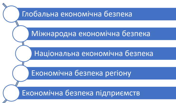
Рис. 6. Ієрархія рівнів економічної безпеки

За ступенем охопту, розрізняють наступні рівні економічної безпеки: