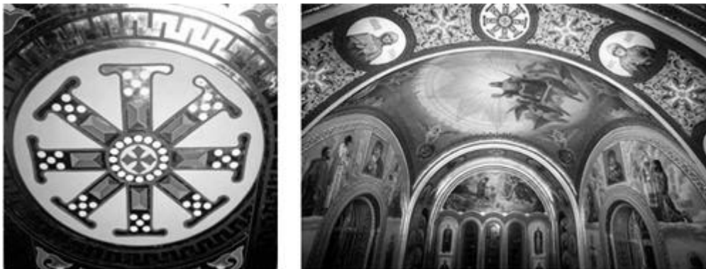
Мал. 1. Мандала в Софійському соборі в Києві.

Кілька слів треба сказати щодо самої методики створення мандал. Коли я пропоную клієнтам намалювати мандалу, я спочатку розповідаю про те, що таке мандала, де вони зустрічаються, як використовуються в різних культурних спільнотах.