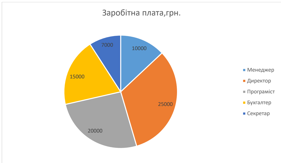
Рис. 3. Кругова діаграма.