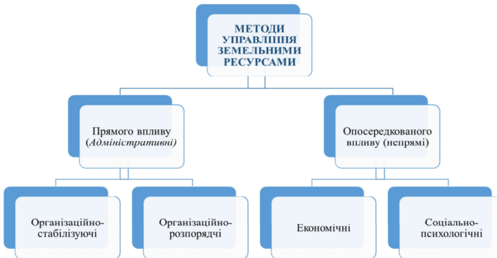
Рисунок 2.3 – Класифікація методів управління земельними ресурсами

У науковій літературі зустрічаються різні класифікації функцій управління, залежно від галузі дослідження: промисловість, машинобудування, військова справа, промислове дорожнє будівництво, аграрний сектор тощо. Проте донині немає в Україні наукової і спеціальної літератури, де б розглядались питання функцій управління земельними ресурсами.