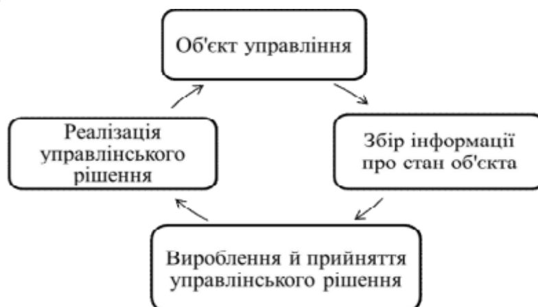
Рисунок 2.4 – Схема управління земельними ресурсами

Процес управління земельними ресурсами можна подати у вигляді схеми (рис. 2.4).