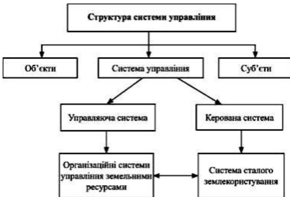
Рисунок 2.1 – Схема структури системи управління

У системі управління виділяють дві підсистеми: управляючу і керовану (рис. 2.1).