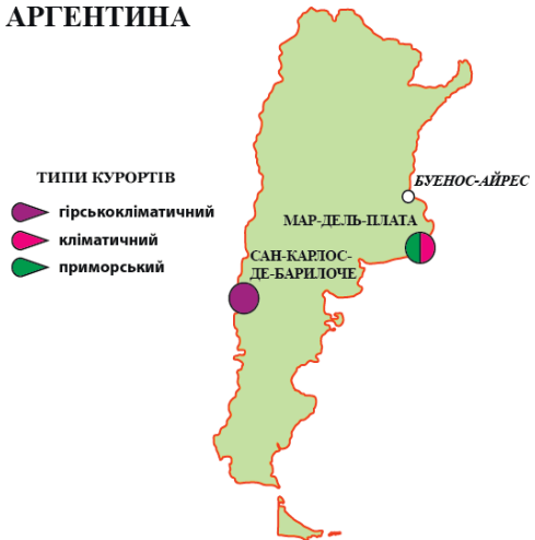
Рис. 5.1. Курорти Аргентини

Переважно на основі сприятливих кліматичних ресурсів розвивається курортне господарство Аргентини (Рис. 5.1). Найвідоміші приморські курорти Атлантики – Мар-дель-Плата, Мірамар, Мар-дель-Сур –