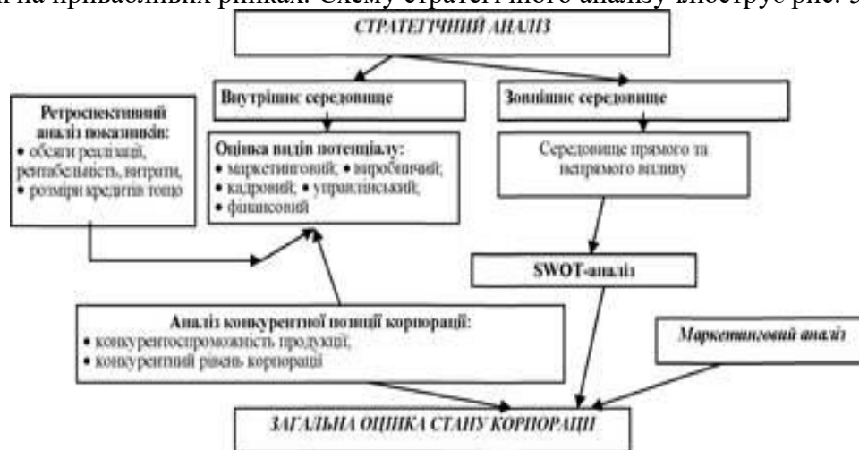
Рис. 5.10. Схema стратегічного аналізу

Стратегічний аналіз як вид аналітичної роботи є окремим елементом системи стратегічного планування який використовується в якості основи при прогнозуванні позиції корпорації на привабливих ринках. Схему стратегічного аналізу ілюструє рис. 5.10: