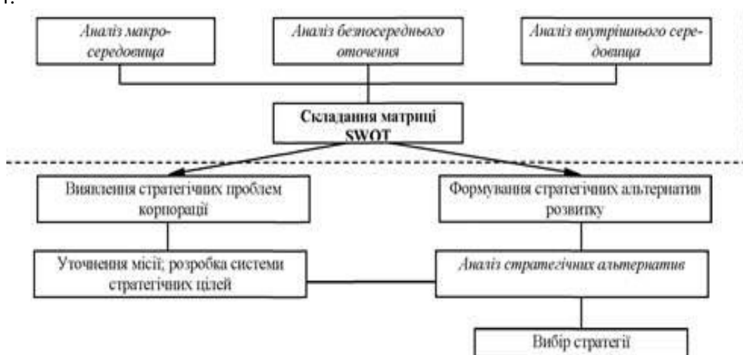
Рис. 5.4. Етапи SWOT-аналізу в процесі вибору стратегії корпорації

Схема процесу SWOT-аналізу та всі його етапи при виборі стратегії корпорації наведені на рис. 5.4: