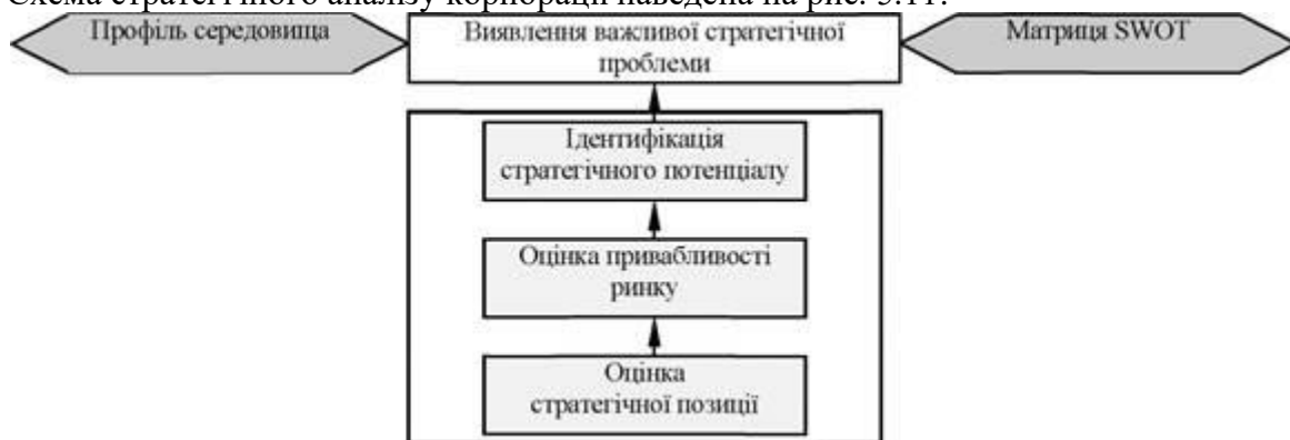
Рис. 5.11 Схema стратегічного аналізу корпорації (за Ігнат'євою І. А.)

Схema стратегічного аналізу корпорації наведена на рис. 5.11: