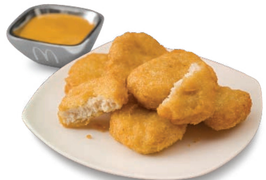
Фото: Пекін, Китай.

МИ РОЗШИРЮЄМО НАШ БІЗНЕС, ОТРИМУЮЧИ ПРИБУТКИ