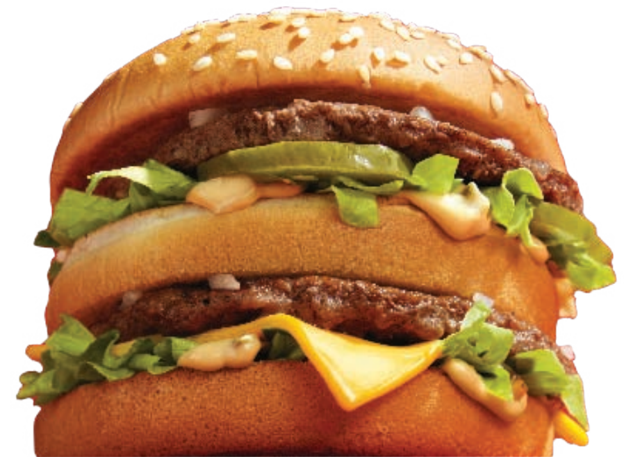
Фото: Лондон, Велика Британія

Ці Норми не застосовуються до власників (керівників) ресторанів мережі «МакДональдз» або до їхніх працівників, адже це незалежні особи. Проте, ми очікуємо від власників (керівників) ресторанів мережі «МакДональдз» дотримання високих стандартів чесності та виконання всіх законодавчих та нормативних вимог, зокрема щодо прав людини, безпеки праці, винагородження та поведіння з працівниками.