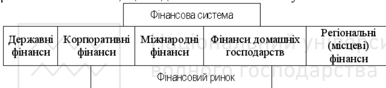
Рис 1.1. Структурні сфери фінансової системи

Функціонування ринку неможливе без роботи фінансової системи, що забезпечує його нормальне існування і розвиток. Фінансовий ринок є важливим каналом фінансування економіки, фундаментом фінансової системи, що надає їй стабільності й усталеності.