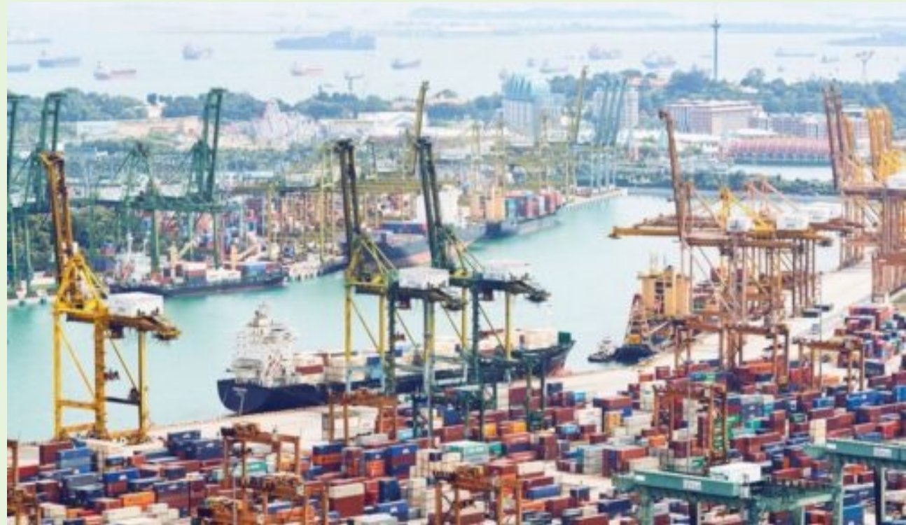
Морський порт Сінгапуру