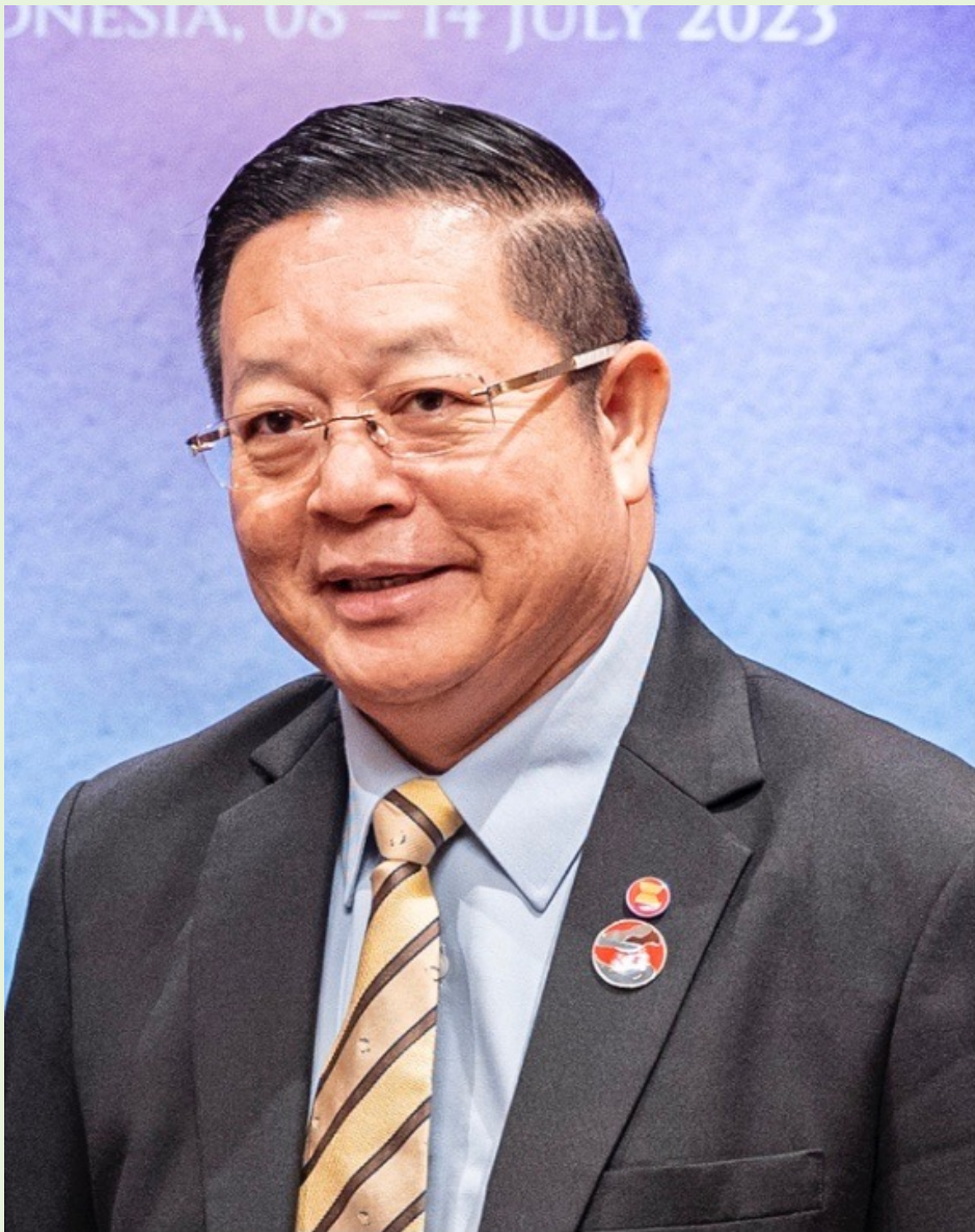
Генеральний секретар АСЕАН з 2023 р. Као Кім Хурн (Камбоджа)