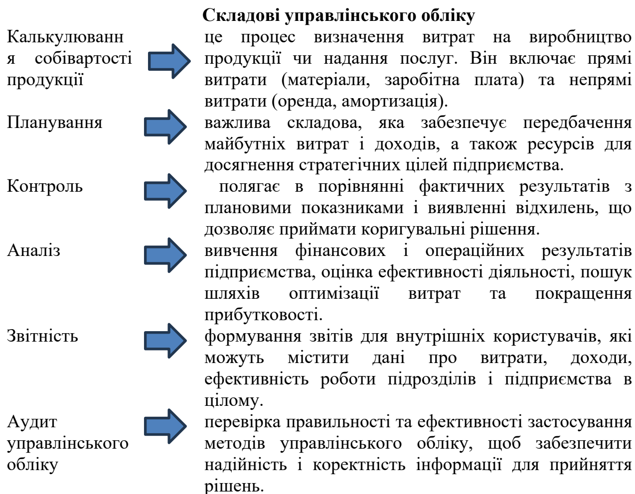
Рисунок 1.1 – Складові частини управлінського обліку

Нижче подано основні складові управлінського обліку (рис. 1.1).