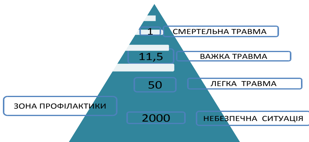
Рисунок 1.2 – Розподіл травм за ступенем тяжкості і зона профілактики виробничого травматизму

На основі аналізу травматизму в Україні та різних країнах Європи з урахуванням методики МОП, встановлено, що в середньому на один нещасний випадок зі смертельним наслідком припадає певна кількість травмованих із менш тяжкими травмами. Для країн Європи це співвідношення коливається в межах від 1:500 до 1:2000 випадків , а в Україні – від 1:50 до 1:11,5 випадків, тобто, починаючи з 2010 року, на 1 нещасний випадок із смертельним наслідком припадало майже у 10...174 разів менше нещасних випадків із менш тяжкими травмами ніж у країнах Європи. Розподіл травм за ступенем тяжкості за наслідками нещасних випадків і зона профілактики виробничого травматизму наведені на рисунку 2.