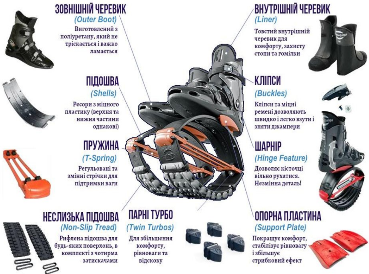
Рисунок 4 – Будова черевиків Kangoo Jumps

дві підошви, одна з яких виконана з додаванням неслизького матеріалу; пружина; кліпси; опорна пластина; шарнір (рис. 4).