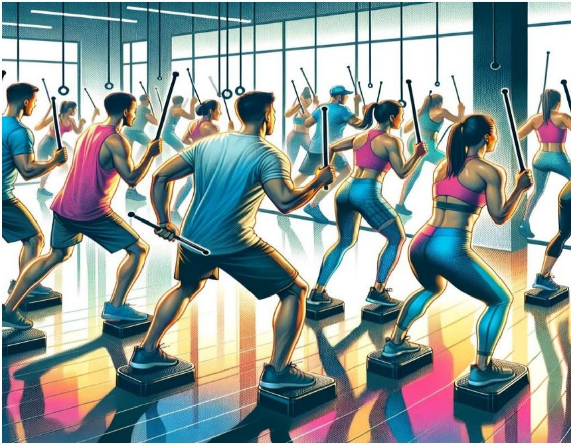
Рисунок 3 – Фітнес-тренування за системою Round Fitness

Для використання цієї системи на уроках фізичної культури потрібна мінімальна підготовка. Для занять знадобляться спеціальні палички або їхні легкі замітники, а також простір для рухів. Урок можна структурувати таким чином: розминка, основна частина та заминка. Під час розминки учні виконують легкі вправи для розігріву м'язів. Основна частина включає базові рухи системи Round Fitness, такі як присідання, випади, нахили та удари паличками в ритмі музики. Заминка може складатися з розтягування і дихальних вправ.