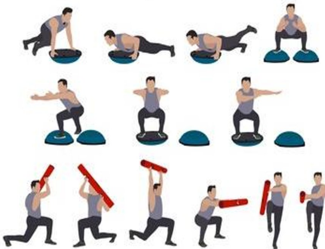
Рисунок 1 – Фітнес-тренування із застосуванням BOSU balance trainer

Таким чином, BOSU Balance Trainer є ефективним засобом як для тренувальних програм (рис. 1), так і для реабілітаційних заходів, спрямованих на вдосконалення рухових навичок і функціональної підготовки.