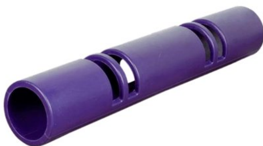
Рисунок 2 – Функціональний тренажер ViPR Trainer

Функціональний тренажер ViPR Trainer – це порожнистий циліндр, відрізок труби завдовжки 107 см, вага якого становить 4, 6, 8 або 10 кг. Залежно від цього обирається відповідне навантаження для виконання певного комплексу вправ. ViPR (рис. 2) має декілька отворів для хвату, що сприяє урізноманітненню виконуваних вправ і надає навантаження на цільові м'язи. Також цей тренажер необхідний для виконання різноманітних вправ, таких як махи, підйоми, тяги, обертання та інші. Він дозволяє працювати з різними групами м'язів і покращувати рухову симетрію та координацію.