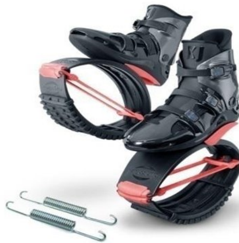
Рисунок 7 – KJ PRO7 для спортсменів або великогабаритних людей

Успіх занять у пружинистих черевиках Kangoo Jumps пов'язаний з відчуттями невагомості під час стрибка. Учасники набувають залежності від цього виду фітнесу. Базові рухи неймовірно прості, причому складність і рівень інтенсивності зростає з кожним новим тренуванням.