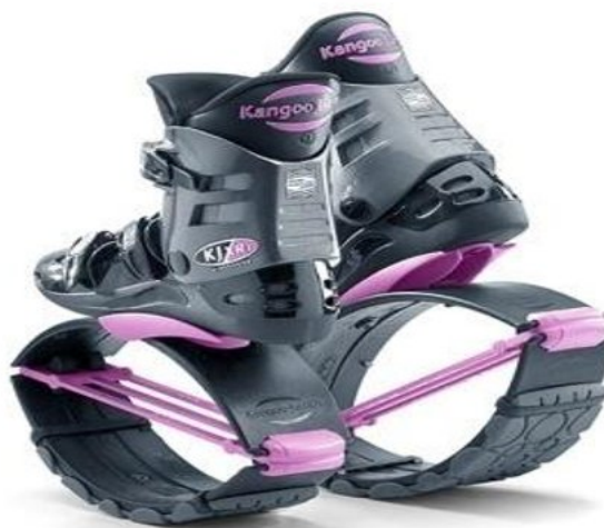
Рисунок 5 – KJ XR3 для занять Kangoo Power

Існує декілька видів черевиків Kangoo Jumps (рис. 5-7).