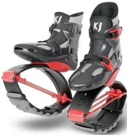
Рисунок 6 – KJ Power Shoe Дитячі