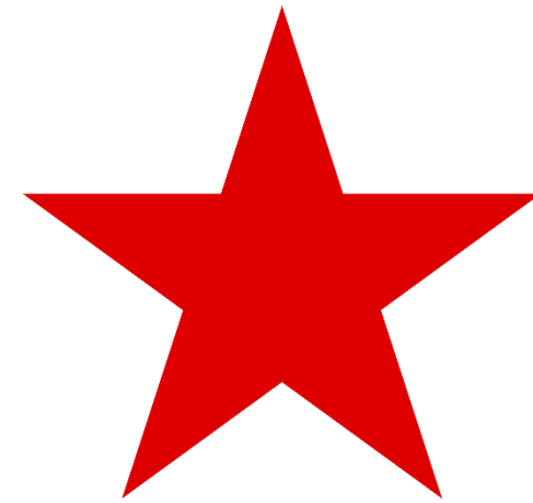
Vajnai v. Hungary (No. 33629/06, 2010)