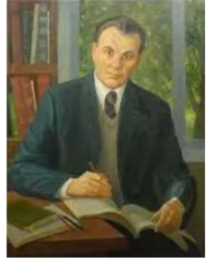
В. О. Сухомлинський

Дитину не можна перевантажувати безліччю фактів – це заважає їй цілісно сприймати розповідь, адже процес сприймання притуплюється і тоді дитину дуже складно чимось зацікавити, вмотивувати, спонукати до пізнання оточуючого світу.