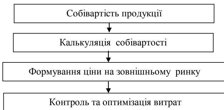
Рисунок 5.2 - Вплив калькуляції собівартості на ціноутворення

Рисунок 5.2 ілюструє вплив калькуляції собівартості на процес формування ціни та управління витратами. Вона показує, що визначення собівартості продукції є основою для подальшого ціноутворення та контролю витрат, що дозволяє підприємству ефективно управляти фінансовими результатами на зовнішніх ринках.