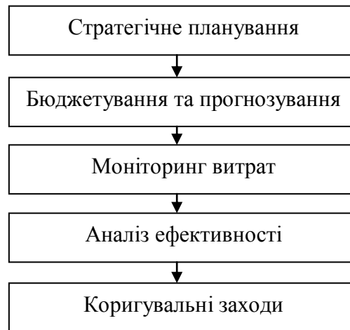
Рисунок 8.1 - Основні етапи управління витратами в ТНК

включати оптимізацію процесів, зміну постачальників або перегляд виробничих процедур, що забезпечує підвищення ефективності управління витратами та зниження фінансових ризиків.