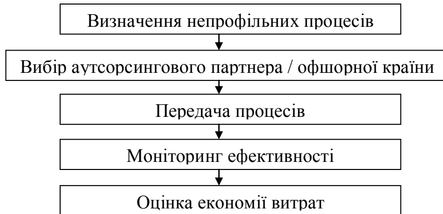
Рисунок 8.3 - Використання аутсорсингу та офшорингу для зниження витрат

Процес використання аутсорсингу та офшорингу у вигляді рисунка демонструє ключові етапи від визначення непрофільних процесів до оцінки економії витрат.