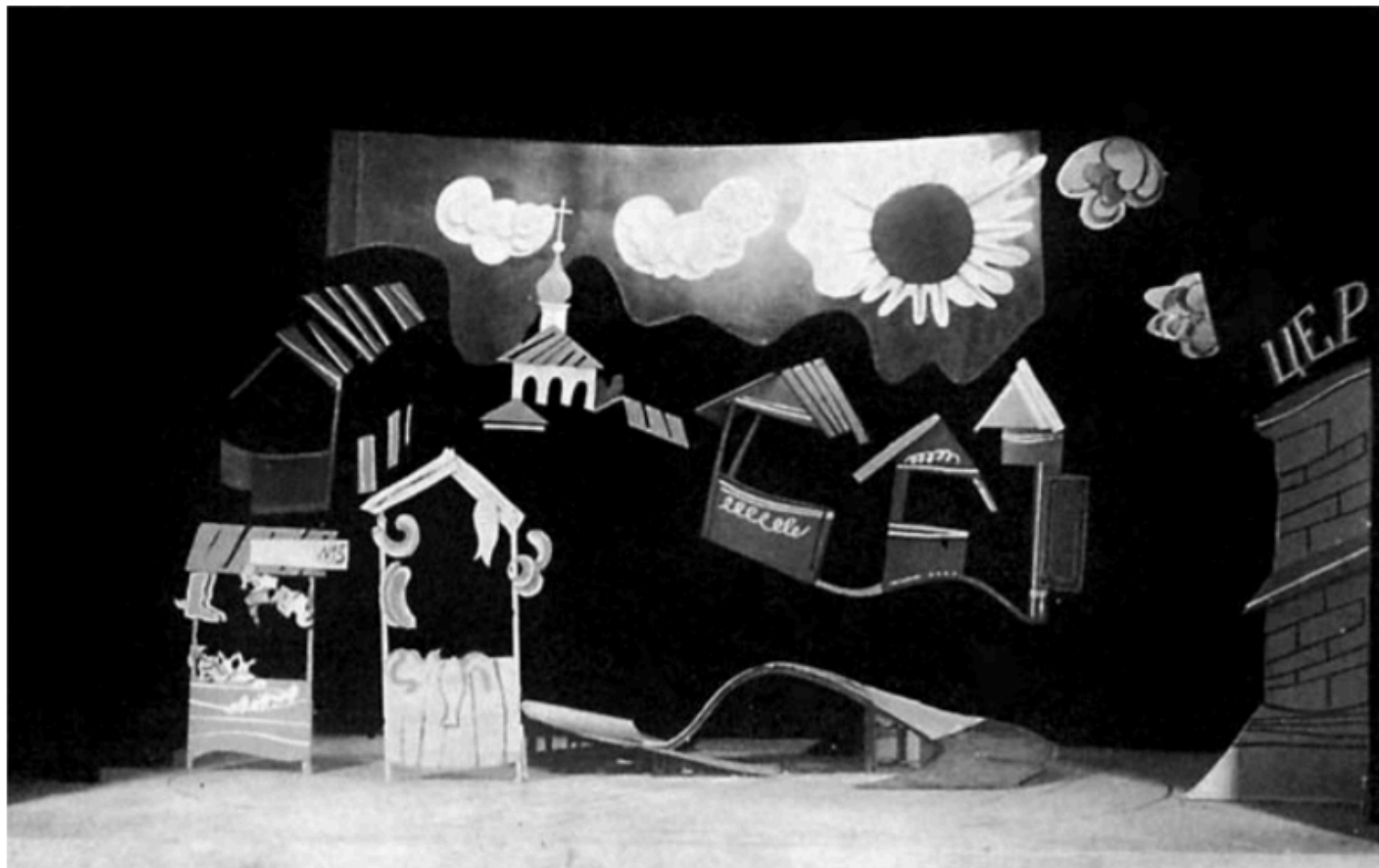
Б. Косарев. Макет декорації до вистави «За двома зайцями» за М. Старицьким, Червонозаводський театр. 1928