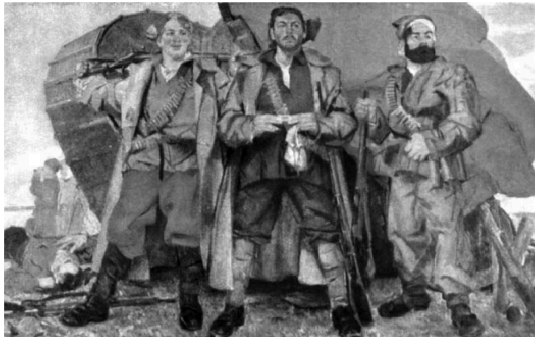
А. Петрицький. Переможці Врангеля. П. о. 1935