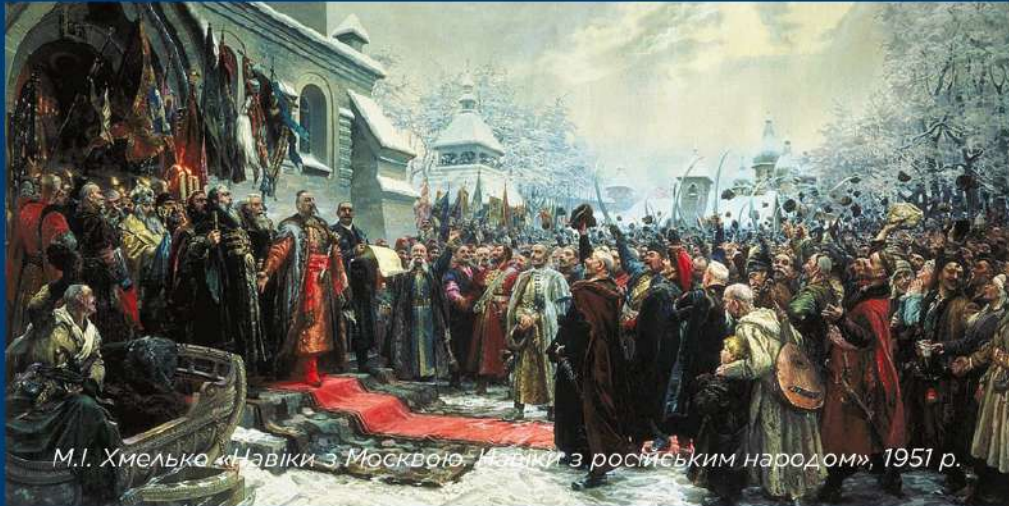
М.І. Хмелько «Навіки з Москвою. Навіки з російським народом», 1951 р.

«1654 р. на Переяславській раді відбулося возз'єднання України і росії, яке радо вітало все українське суспільство»