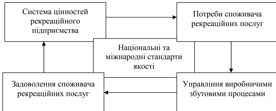
Рис. 1.3. Модель управління якістю рекреаційної послуги

В еру повільного зростання ринку найкращим джерелом нових можливостей для бізнесу є постійні клієнти. Дешевше проводити програми, спрямовані на задоволення вже наявних клієнтів, ніж витратити гроші на пошук нових. Рекреаційні підприємства, які вміють забезпечити високий рівень якості обслуговування, мають можливість встановлювати більш високу ціну на продукцію, розвиваються більш високими темпами і отримують більший прибуток.