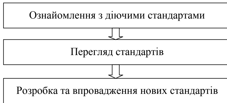
Рис. 1.2. Процес удосконалення системи управління якістю

Це теж є процесом вдосконалення системи управління якістю. Тому за аналогією з циклом PDCA можна говорити про цикл SDCA, тобто "Стандартизація - дія – контроль результатів - коригуючий вплив".