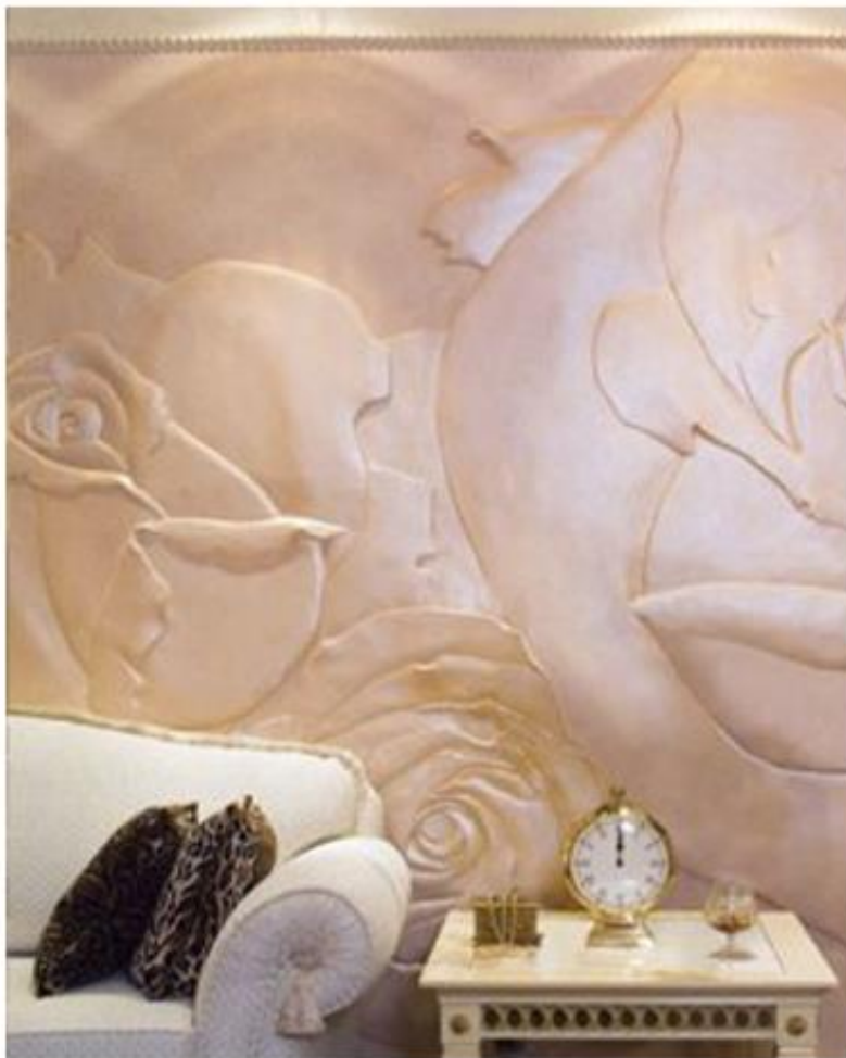
Рис. № 11 Барельєф тонований на стіні