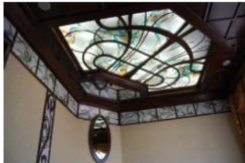
Рис. №4 Декоративний вітраж на стелі