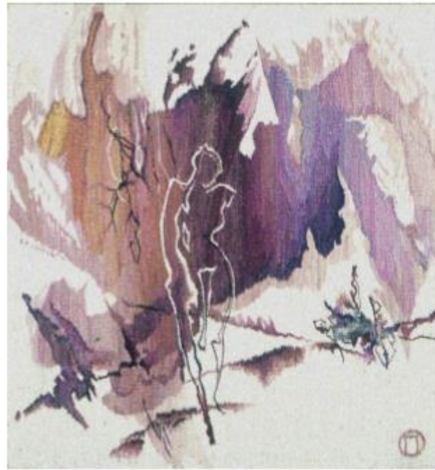
Рис. № 10 Гобелен О. Попова "Мандри Псіхеї чи Я занурююсь в хвилі марень"