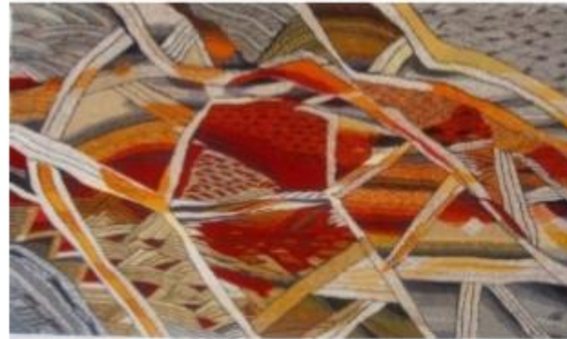
Рис. №8 Гобелен Б. Губаль "Переплелись, як мамине життя"