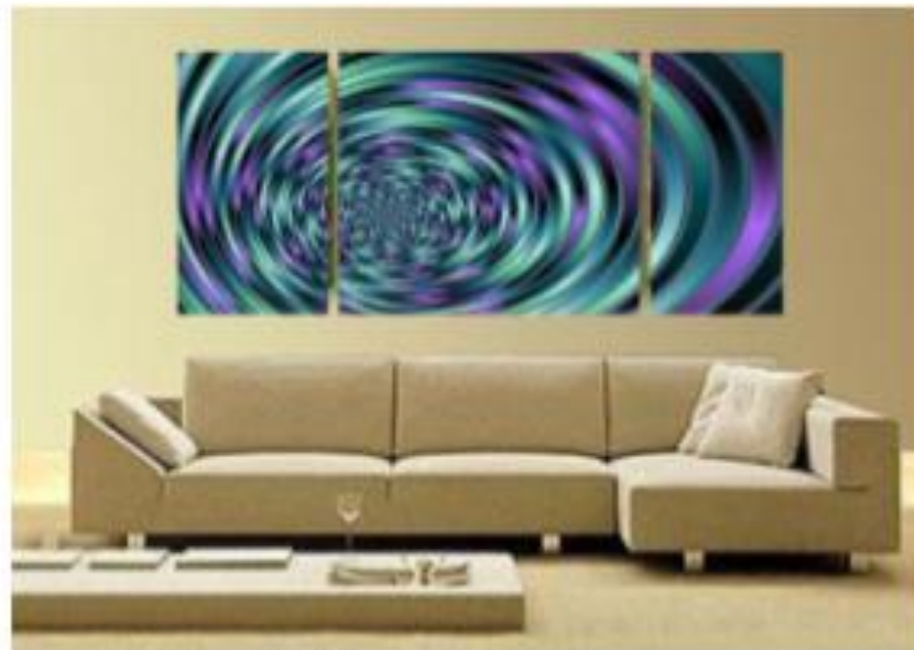
Рис. № 2 Моментально-декоративний (грізаль з фоном) (кольорова оптична ілюзія)