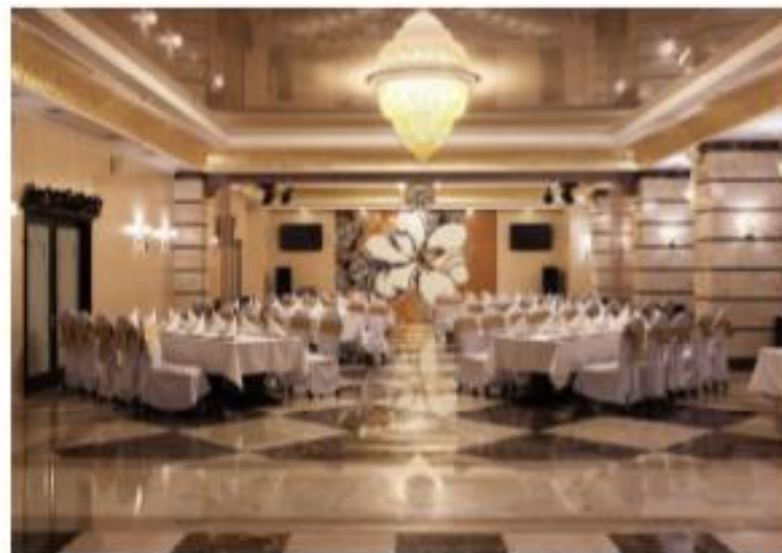
Рис. № 6 Мозаїчна композиція "Квітка" (ресторан готелю "Україна" м. Київ)