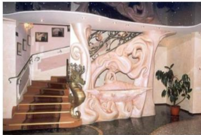
Рис. № 13 Горельєф готелю "Перлина Дніпра" м. Київ