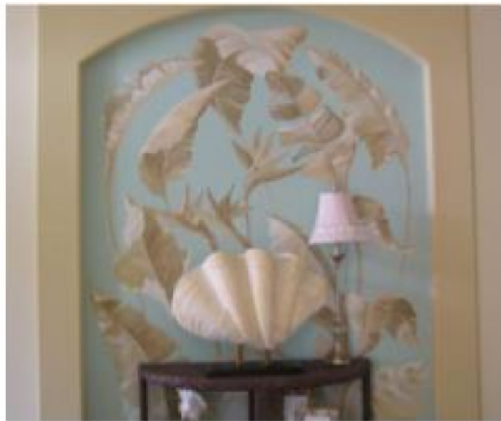
Рис. № 1 Моментальний розпис