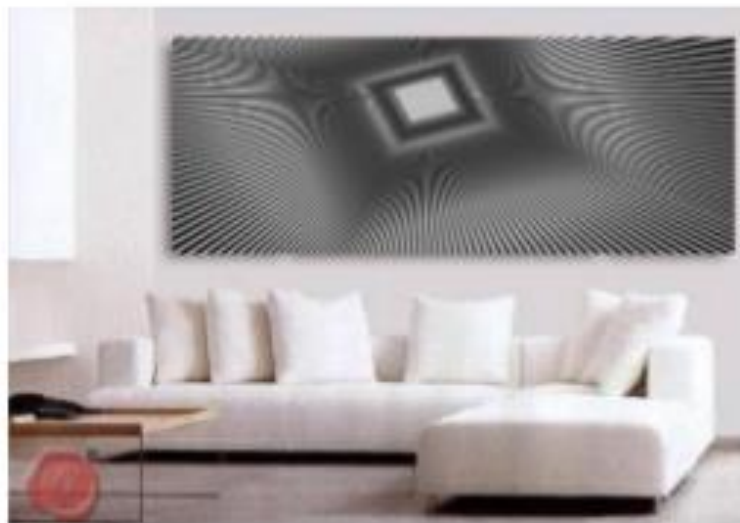
Рис. № 3 Моментально-декоративний розпис (чорно-біла оптична ілюзія) за стилем Тіффані