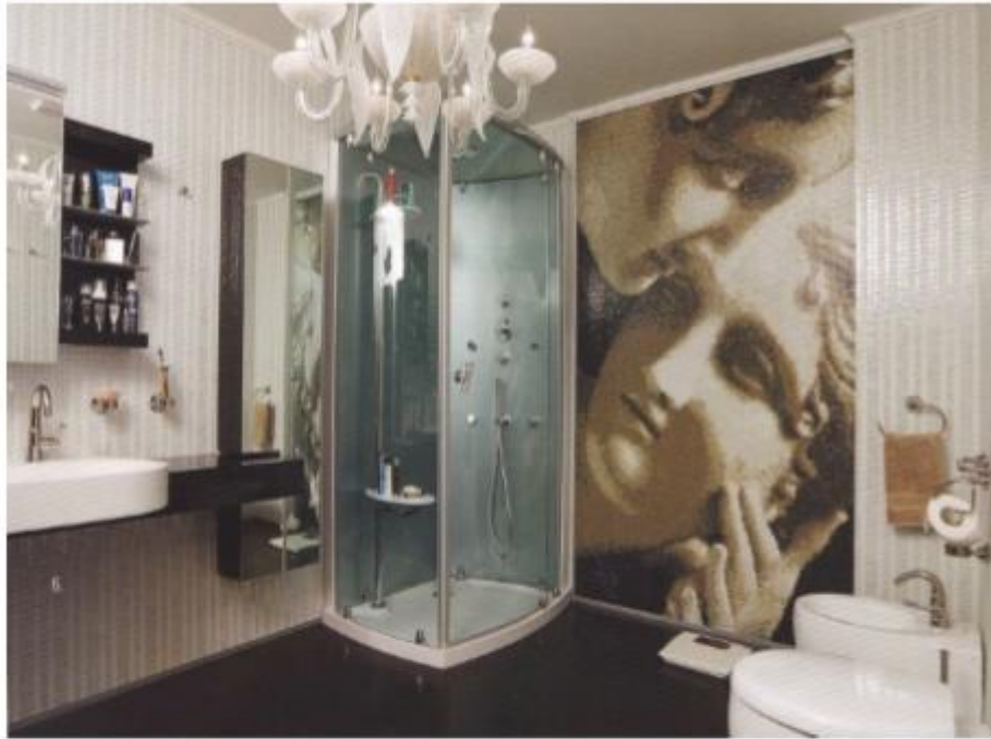
Рис. № 7 Мозаїчне панно в санвузлі готельного номеру