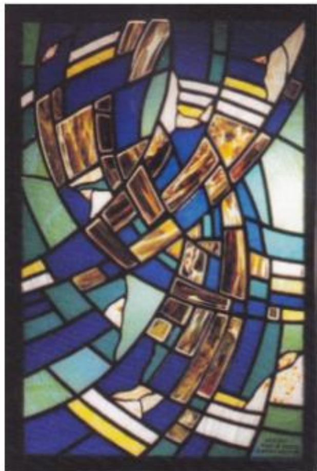
Рис. № 5 Вітраж "Млин" Олег Янковський