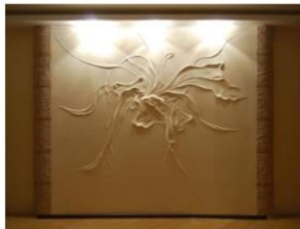
Рис. № 12 Барельєф з підсвітками