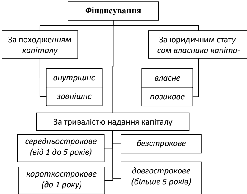
Рис. 7.1. Класифікація фінансування проєкту

Зазвичай доцільно поєднувати декілька основних джерел фінансування (більшість джерел мають свої переваги та недоліки, змішане фінансування може виправити одні недоліки за рахунок інших, у найгіршому ж випадку можна одержати різні недоліки), хоча вибір монофінансування має свої переваги. Віднедавна деякі види проєктів розвивають із застосуванням фандрейзингу (з англ. fundraising ) – це процес пошуку і збору добровільних фінансових внесків шляхом залучення приватних осіб, підприємств, благодійних фондів чи державних установ. Хоча до збору коштів переважно