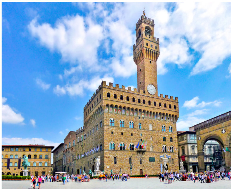
Piazza della Signoria a Firenze

Le piazze sono il centro della vita degli italiani: sono un luogo dove le persone si incontrano, parlano, bevono un caffè o un aperitivo. Se sei seduto in un caffè all'aperto in una piazza italiana, sei seduto in un teatro: guarda la gente, i palazzi, le attività. È un bellissimo spettacolo e non ti annoierai!