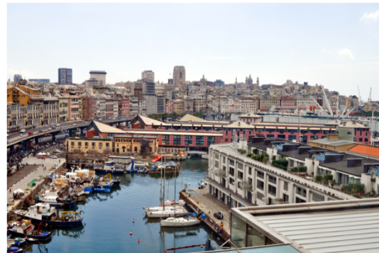
(da sinistra a destra) Torino e Genova

In tutte le città italiane ci sono molte piazze. Alcune piazze sono antiche e hanno importanti monumenti storici ed artistici; altre piazze sono moderne e sono congestionate dal traffico. Molte piazze dei centri storici sono zone pedonali.