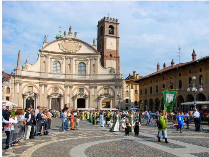
La Piazza del Duomo a Vigevano

La piazza principale è nel centro della città e, durante i secoli, ha avuto importanti funzioni civiche, religiose e commerciali: difatti, nella piazza principale, generalmente c'è una chiesa, un palazzo del Comune e spesso un mercato all'aperto una volta la settimana. Nelle piazze italiane ci sono anche molti ristoranti, caffè e negozi.