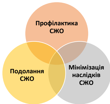
Схема 1. Спрямування соціальних послуг з точки зору впливу на складні життєві обставини (СЖО)

Соціальні послуги мають різні цілі з точки зору впливу на складні життєві обставини особи або сім'ї.