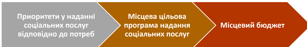
Схема 6. Процес планування соціальних послуг: від відзначення потреб до фінансування

Органи місцевої виконавчої влади та місцевого самоврядування відповідають за розробку, фінансування та виконання місцевих цільових програм надання соціальних послуг, базуючись на результатах визначення потреб та обраних пріоритетів. Регіональні/ місцеві цільові програми визначають заходи та цільові показники, таким чином слугують основою для планування відповідного бюджету (дивись схему 3). Регіональні/ місцеві цільові програми розробляються відповідно до загальних вимог законодавства та власних регламентуючих документів органу влади.