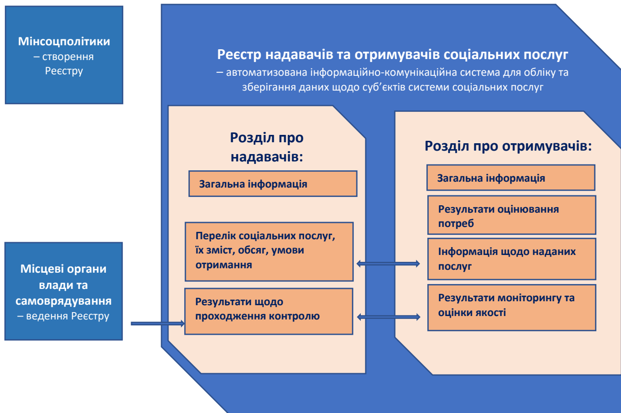
Схема 4. Реєстр надавачів та отримувачів соціальних послуг

Держателем Реєстру буде Мінсоцполітики, порядок формування та ведення реєстру буде затверджено Кабінетом Міністрів України.