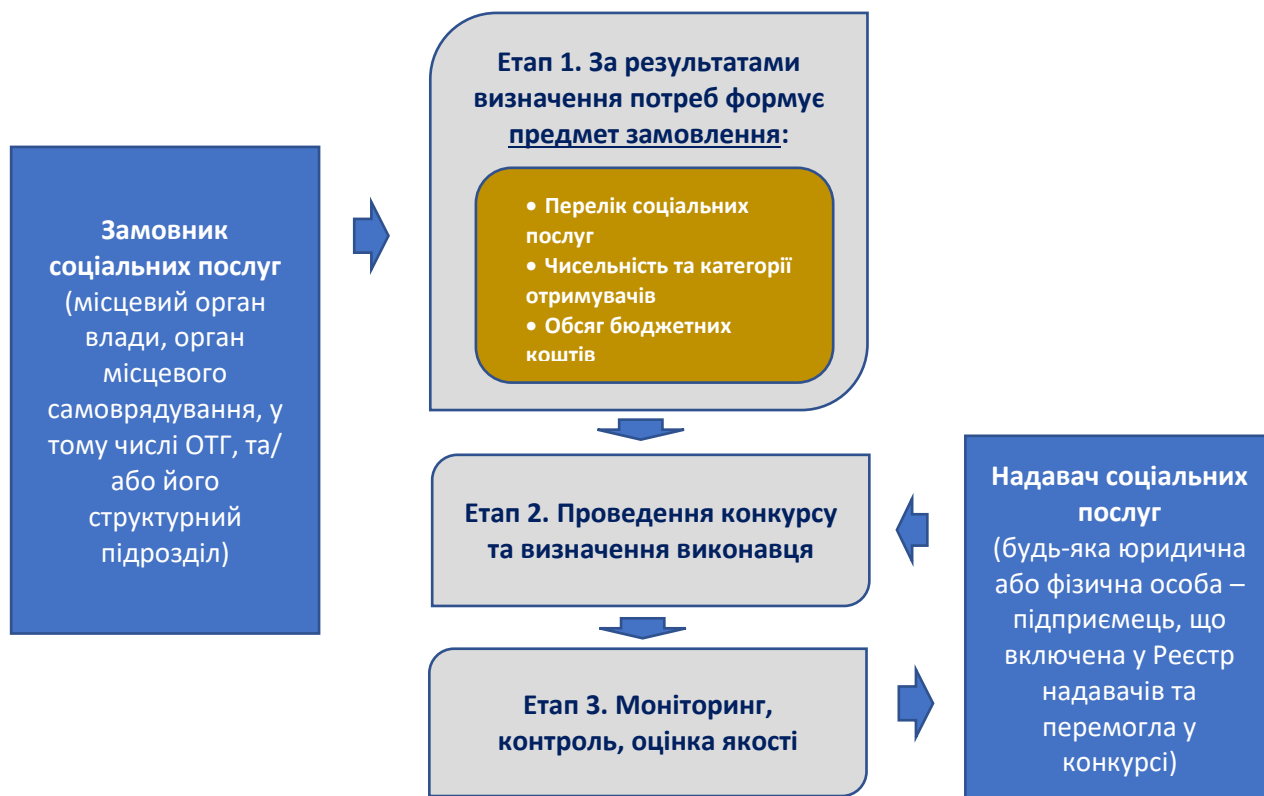
Схема 8. Соціальне замовлення

Замовник соціальних послуг за результатами визначення потреб населення у соціальних послугах формує предмет соціального замовлення (обсяг соціальних послуг та відповідних обсяг коштів), організує конкурс для відбору кращого надавача, здійснює моніторинг, контроль та оцінку якості соціальних послуг (дивись схему 5). Оплата на надані послуги здійснюється замовником шляхом компенсації надавачу вартості наданих послуг.