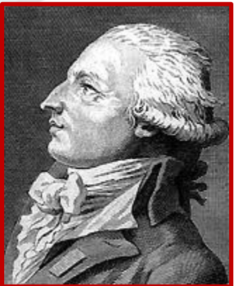
Антуан Дестют де Трасі (1754-1836)