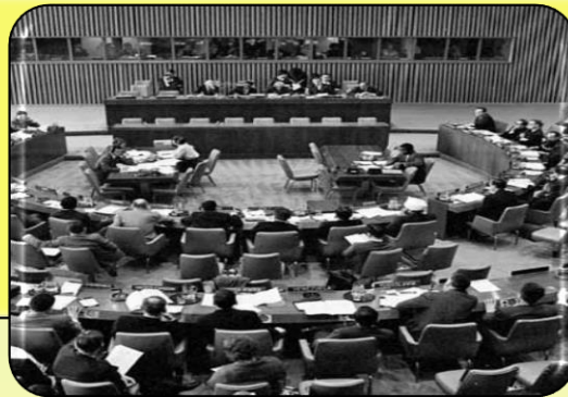
Декларація про принципи міжнародного права 1970 р.