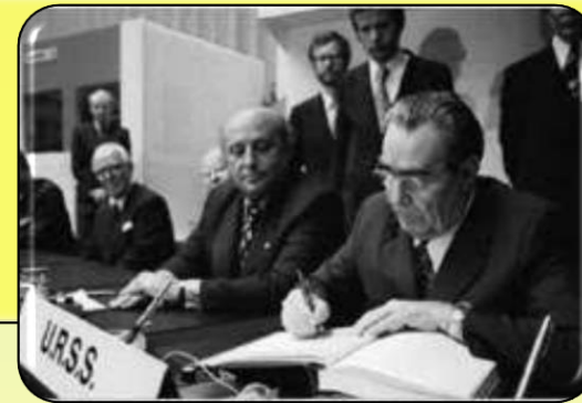
Заключний акт НБСЄ 1975 р.