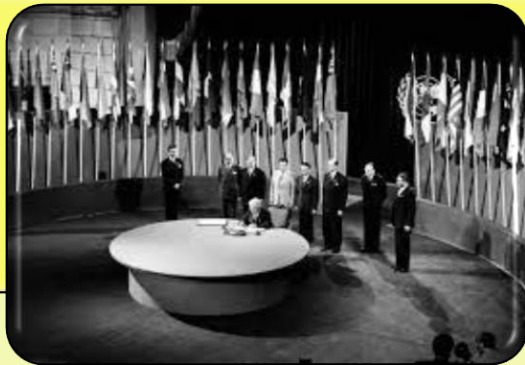
Статут ООН 1945 р