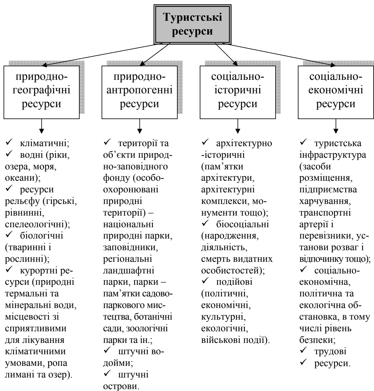
Рисунок 1.4 – Класифікація туристських ресурсів

Зважаючи на це, актуальною проблемою, що постає перед авторами підручника, є також розробка чіткої класифікації видів туризму, що буде прийнятною для подальшого аналізу туристського потенціалу країн світу.