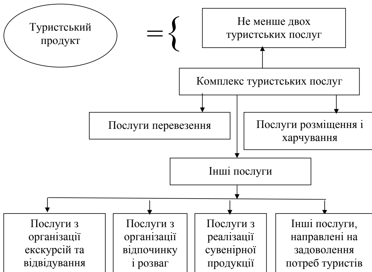
Рисунок 1.1 – Склад туристського продукту

Склад туристського продукту наведено на рисунку 1.1.