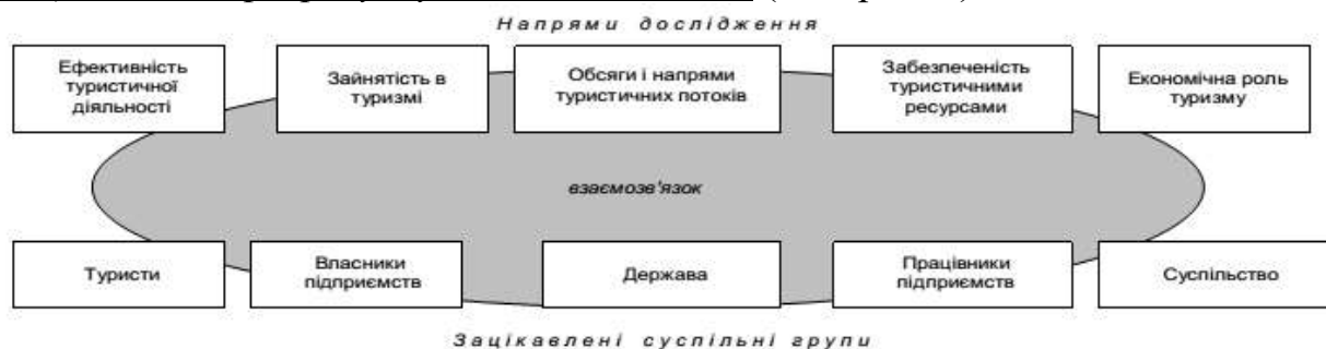
Рис. 1. Групування показників статистики туризму

Всю сукупність показників статистики туризму можна згрупувати за напрямом дослідження та за ознакою значення для певної групи суспільства, що зацікавлена в розрахунку таких показників (див. рис. 1).