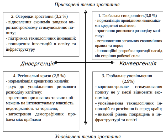
Рисунок 8.3 – Перспективні сценарії глобального розвитку

Вертикальна вісь на рис. 8.3 ілюструє прискорення або уповільнення економічного зростання, тобто якість вирішення довгострокових структурних проблем. Горизонтальна вісь відображає ступінь об'єднання світових економік – їх конвергенцію або дивергенцію, що визначається поєднанням коротко- та довгострокових факторів.