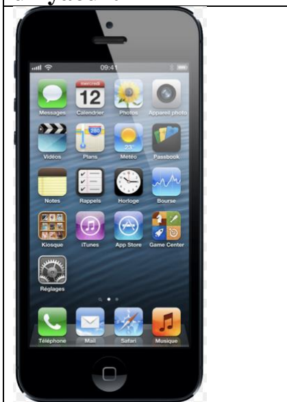
un téléphone portable