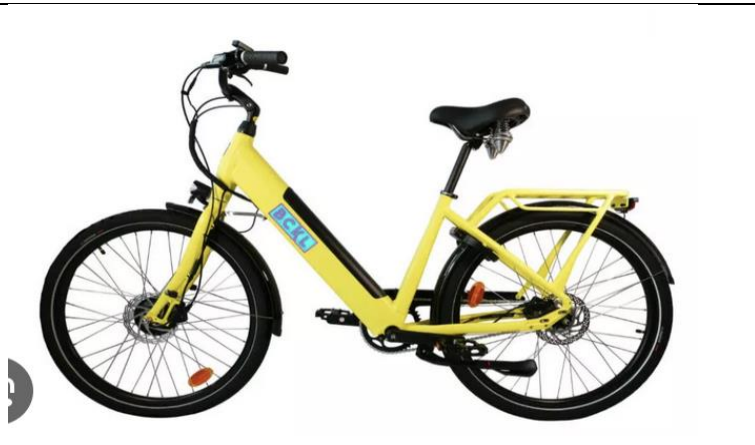
un vélo électrique