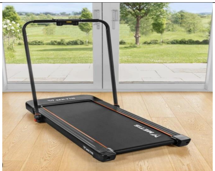
un tapis de marche pliable

6. Quels métiers voudriez-vous faire. Faites une Liste des métiers, puis choisissez une qui vous plairait le plus.