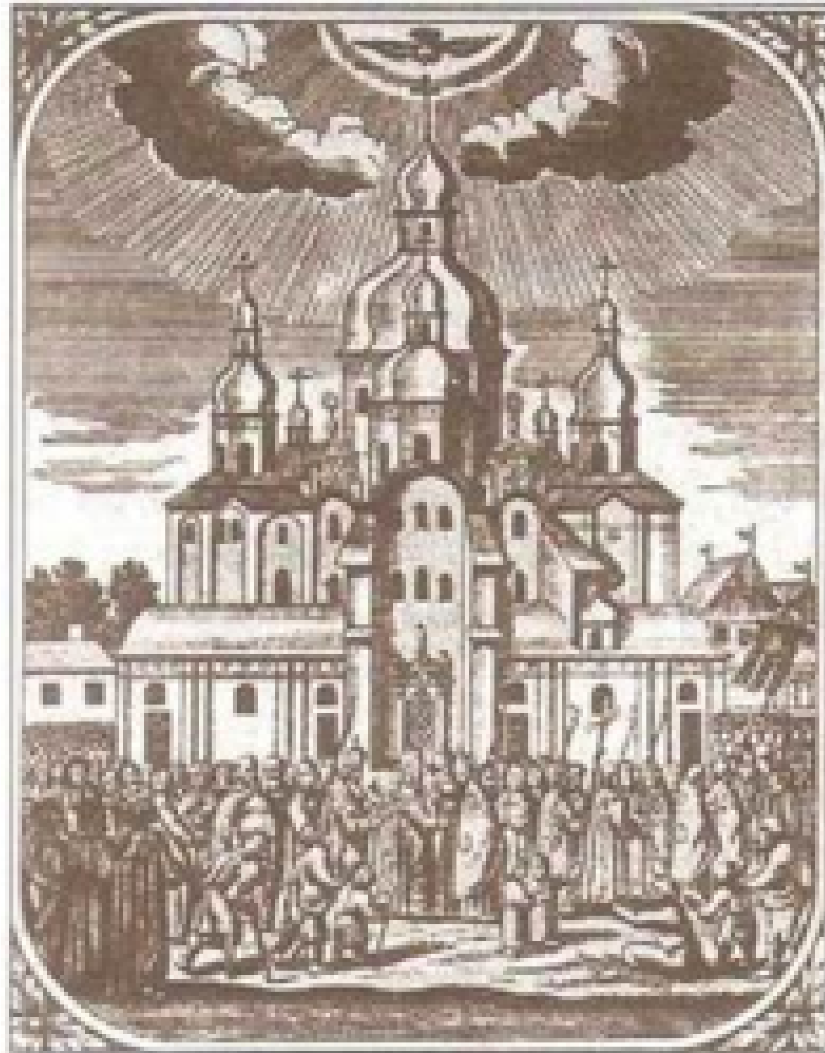
Л. Тарасевич. Сторінка Печерського патерика