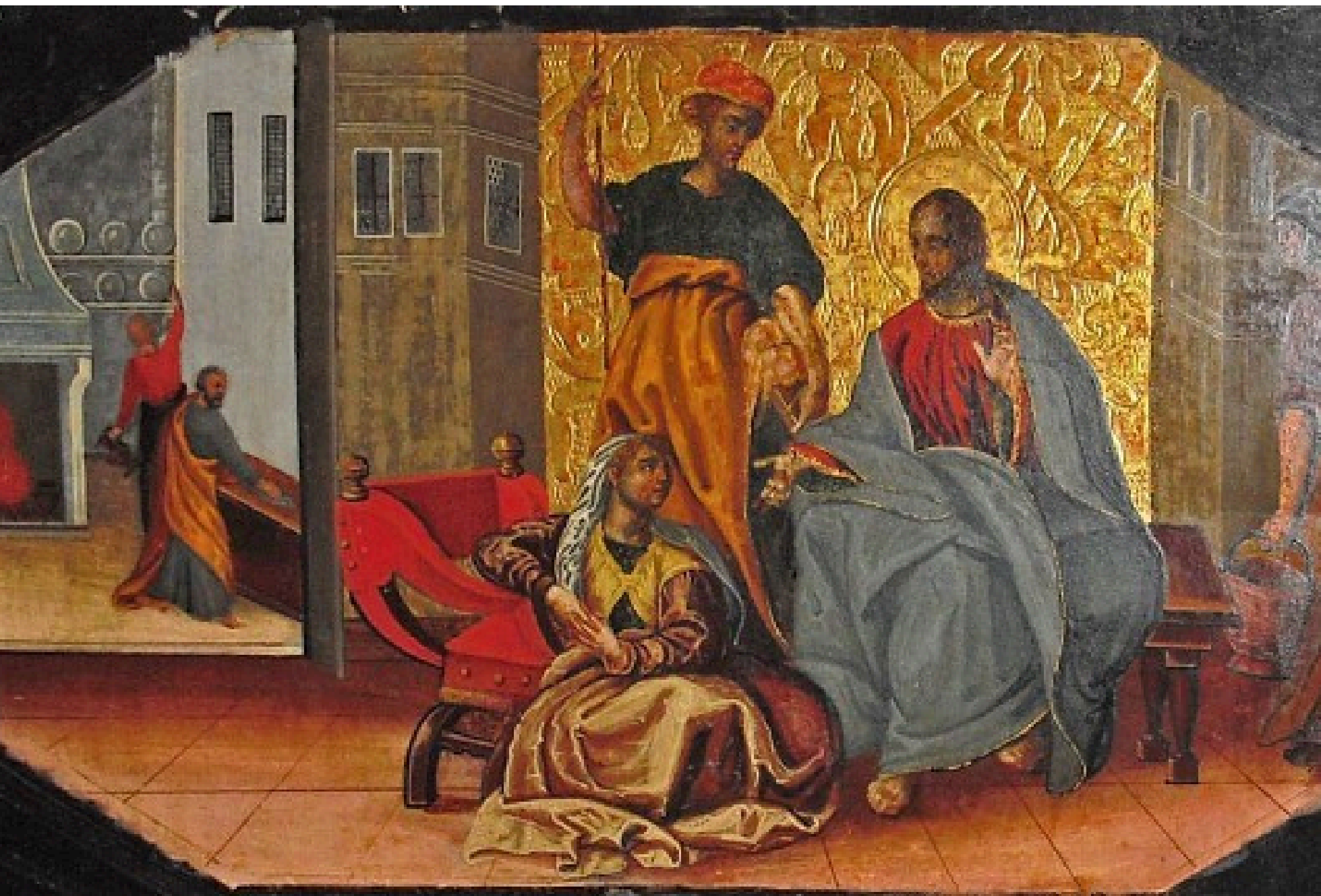
Ісус Христос у Марфи і Марії (1697-1699)