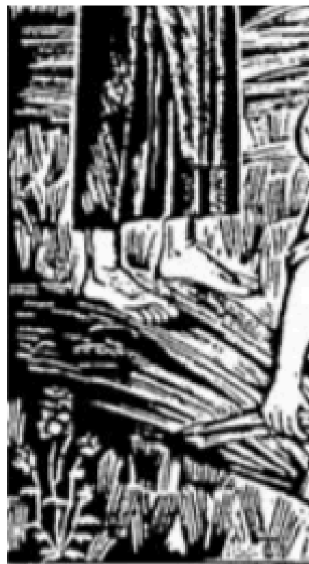
А. Петрицький. «Ексцентричний танок», постановка К. Гохейзов- ського (Москва). 1922