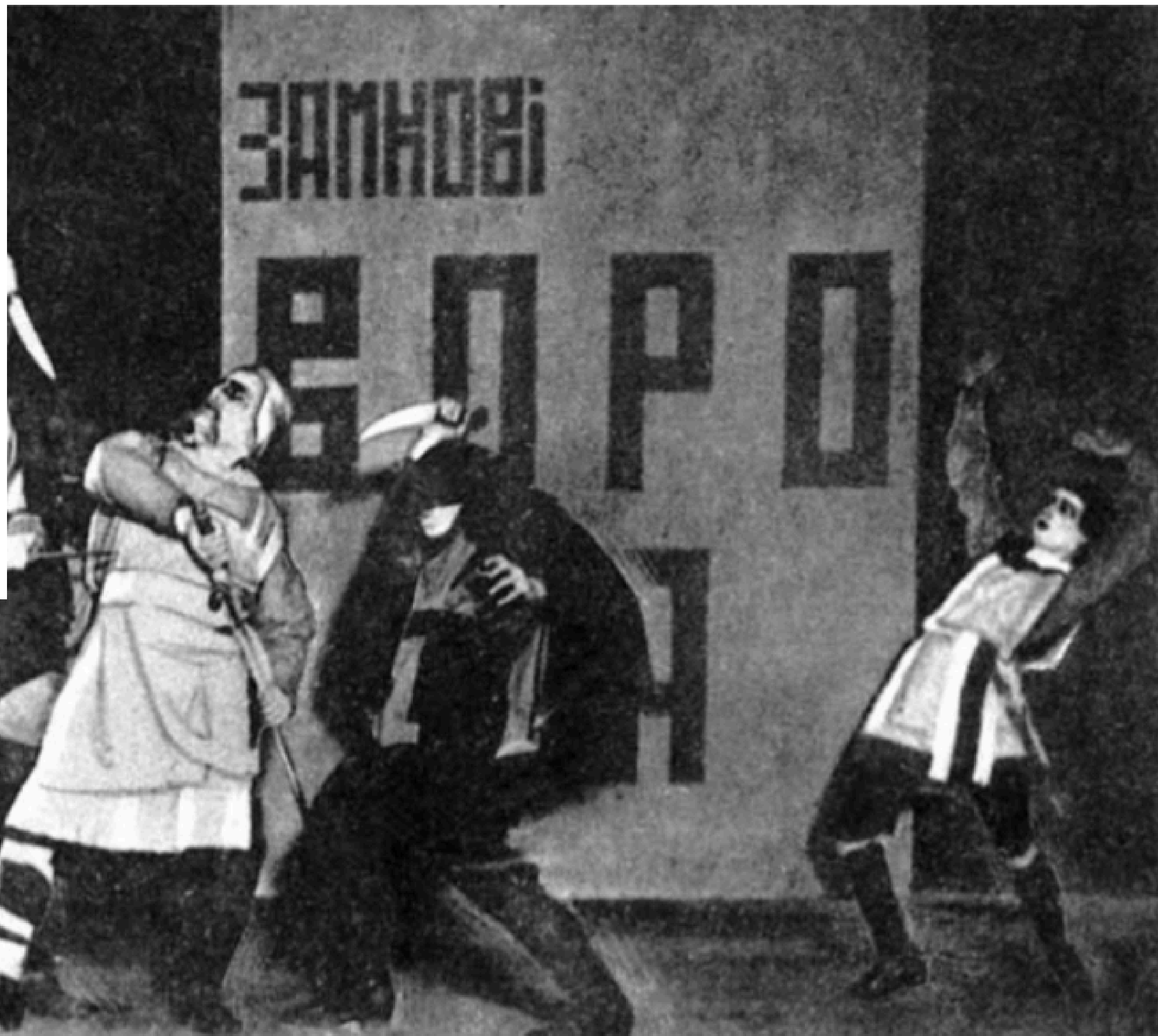
В. Меллер. «Макбет» В. Шекспіра (Театр «Березіль»). 1924