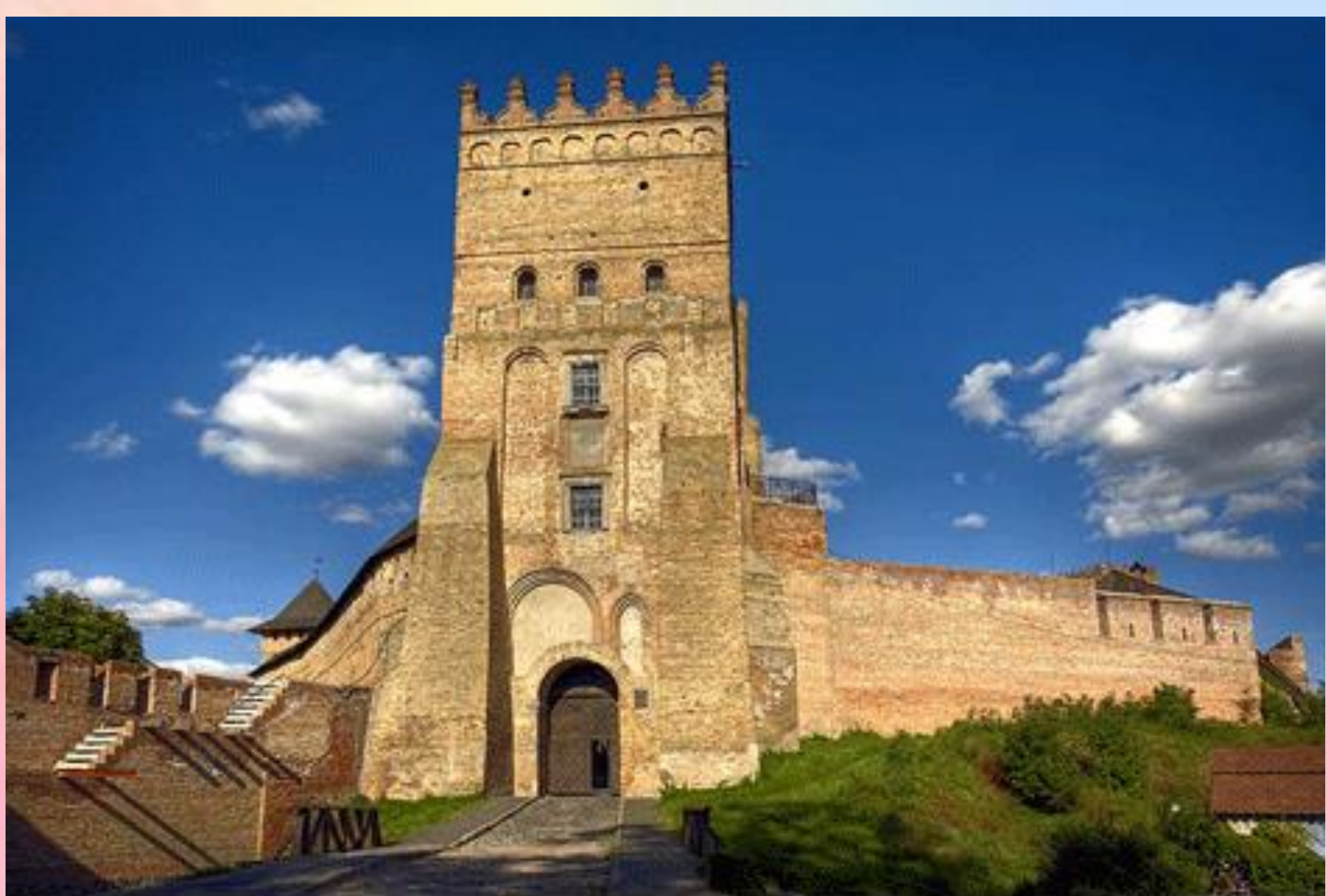
Замок Любарта. Луцьк