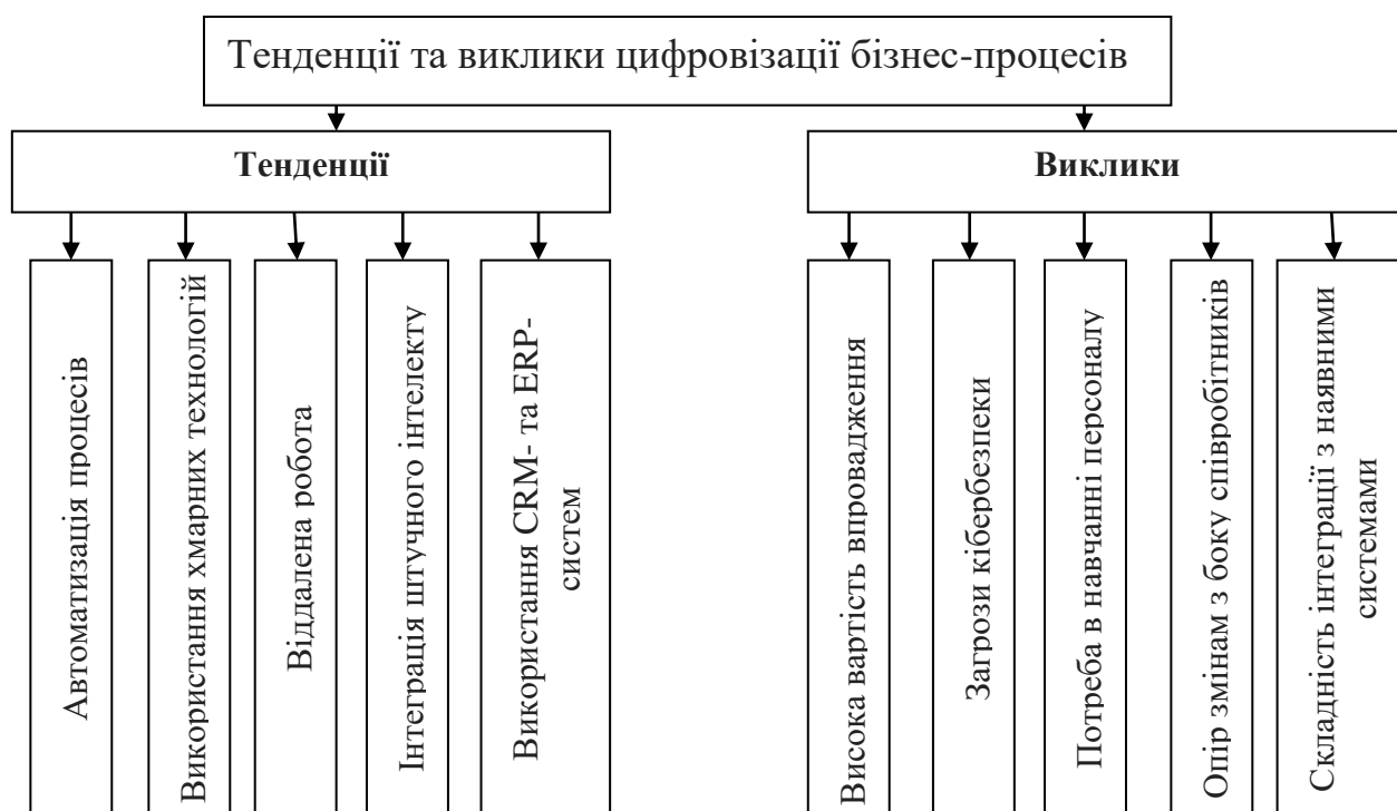
Рисунок 11.1 – Тенденції та виклики цифровізації бізнес-процесів

Проте цифровізація несе й певні виклики. Головна проблема – високі витрати на впровадження нових технологій, що може бути складним для малого та середнього бізнесу. Також існує ризик кібератак та витоку даних, що вимагає додаткових заходів безпеки. Ще один виклик – необхідність навчання персоналу для ефективного використання нових інструментів.