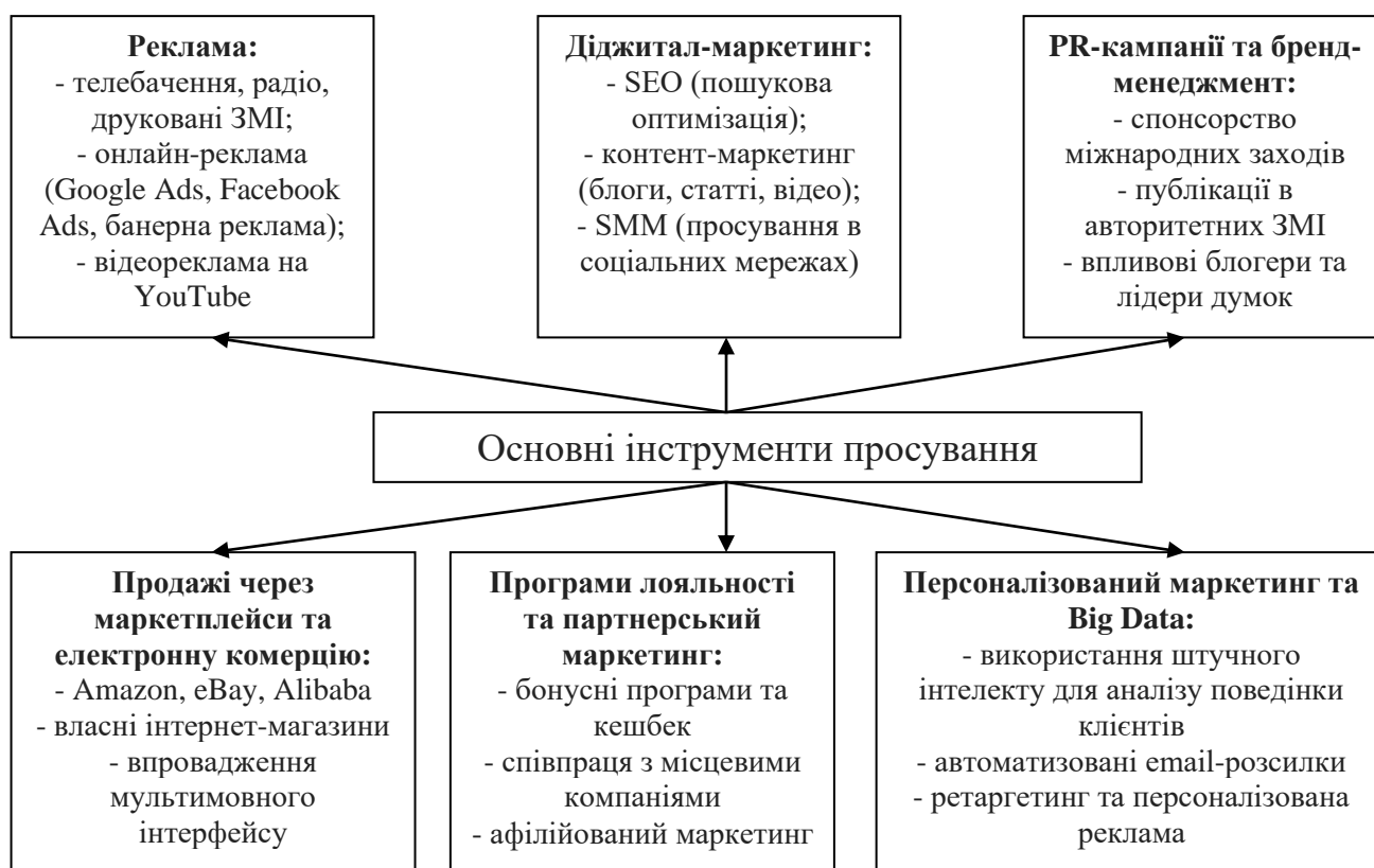
Рисунок 7.1 – Основні інструменти просування

Успішне просування товарів і послуг на міжнародному ринку вимагає використання комплексних маркетингових інструментів. Вони включають як традиційні, так і цифрові методи, що дозволяють залучати споживачів у різних країнах.