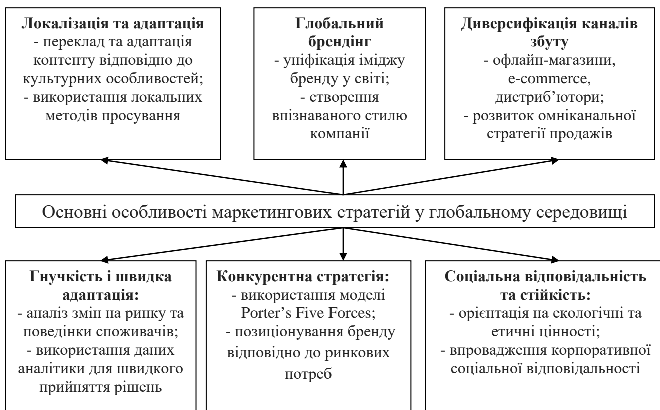
Рисунок 7.2 – Основні особливості маркетингових стратегій у глобальному середовищі

Глобалізація змінює підходи до маркетингу, оскільки компанії виходять на міжнародні ринки, де необхідно враховувати культурні, економічні та соціальні особливості.