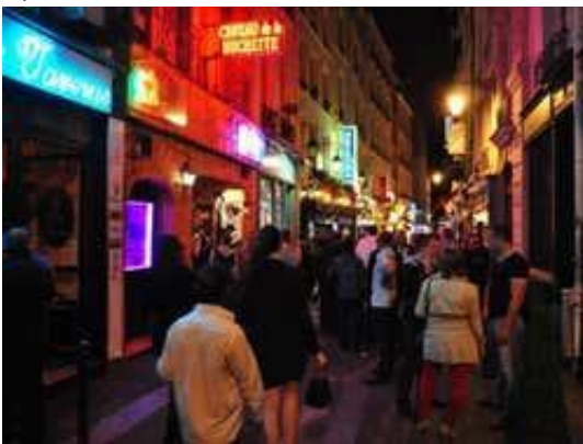
Quartier Latin de nuit