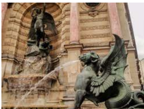
Fontaine de Saint-Michel

Situé entre le 6ème et le 5ème arrondissement de Paris, au cœur du quartier Latin, le quartier Saint-Michel offre un condensé de culture parisienne . Rendez-vous sur la Place Saint-Michel , reliée au pont du même nom, pour admirer l'île de la Cité, la Cathédrale Notre-Dame de Paris, le Palais de Justice et Le Louvre, de l'autre côté de la Seine. Prenez la pause devant la Fontaine Saint-Michel , à l'architecture typiquement haussmannienne. Inauguré en 1860, ce monument historique vaut le détour!