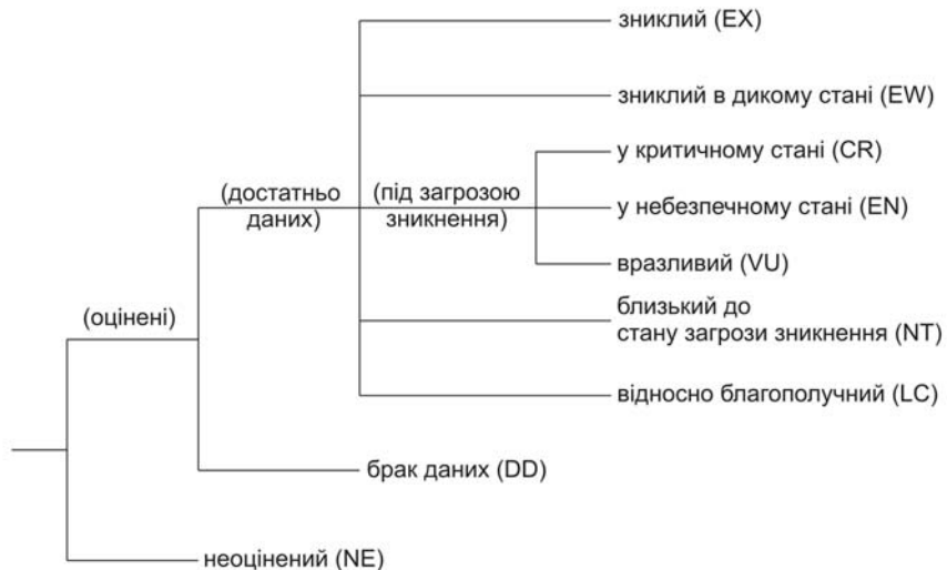
Рис. 1. Структура категорій МСОП (за IUCN..., 2001).

На сьогодні для оцінки статусу виду МСОП використовує дев'ять чітко визначених категорій, до яких може бути віднесений будь-який таксон організмів — наприклад, вид або підвид (IUCN..., 2001). Структура категорій наведена на рис. 1.