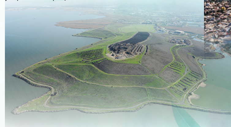
Західний Contra Costa санітарний полігон узбережжя Сан-Франциско