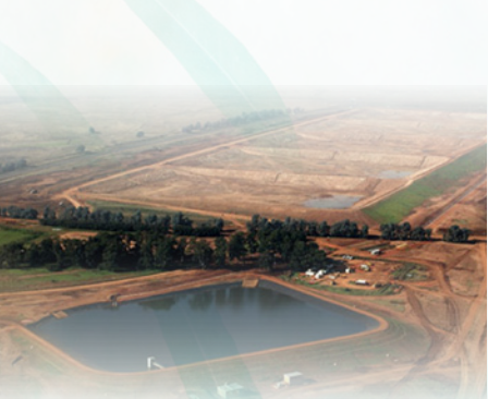
Об'єкт / місце розміщення відходів видобувної промисловості