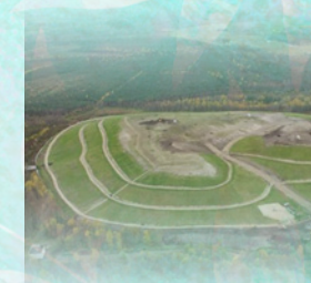
Tallinn Pääsküla полігон, закритий у 2006 році