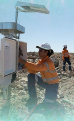
Пост моніторингу О/МРВВ

Роботи із закриття можна розпочинати лише після того, як забезпечено виконання умов, визначених дозволом, і отримано безпосередньо дозвіл на закриття від уповноваженого органу (за поданим оператором запитом). На оператора покладається відповідальність за обслуговування, моніторинг, контроль та вжиття коригуючих заходів на стадії після закриття О/МРВВ протягом строку, який визначається уповноваженим органом.