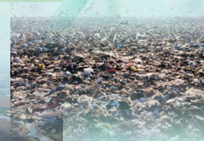
Типове українське сміттєзвалище