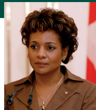
Michaëlle Jean , d'origine haïtienne, a été Gouverneure générale du Canada, de 2005 à 2010.

• des programmes d'éducation bilingue pour les jeunes, en vue de leur permettre de faire la transition entre leur langue maternelle et celle(s) de leur pays d'adoption. »