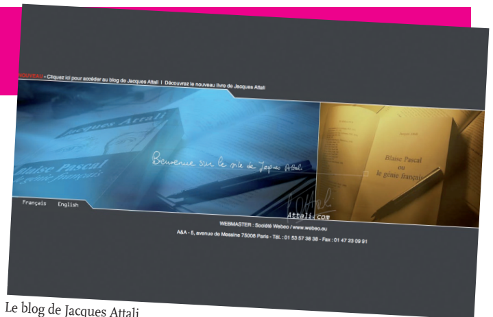
Le blog de Jacques Attali

Vous commencerez un blog de réflexions personnelles sur les événements de l'actualité.