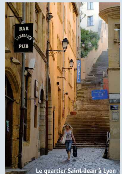
Le quartier Saint-Jean à Lyon

Les années 1960 et 1970 ont été marquées par la construction de nouveaux quartiers à la périphérie des villes. Autour de Paris ont poussé des « villes nouvelles » comme Évry et Marne-la-Vallée. Les centres-villes ont alors été négligés et ont eu tendance à se paupériser. En réaction, à partir des années 1980, dans toutes les villes de France, des campagnes de réhabilitation des quartiers du centre, souvent des quartiers historiques, ont été lancées. Une population de gens aisés s'est réinstallée dans les centres-villes, participant à leur entretien et à leur embellissement.