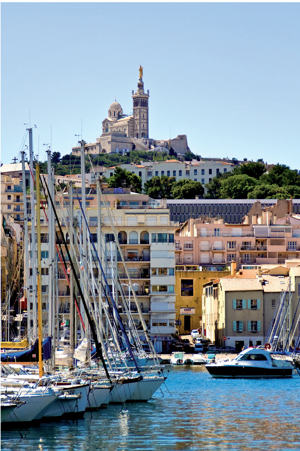
Port de Marseille.