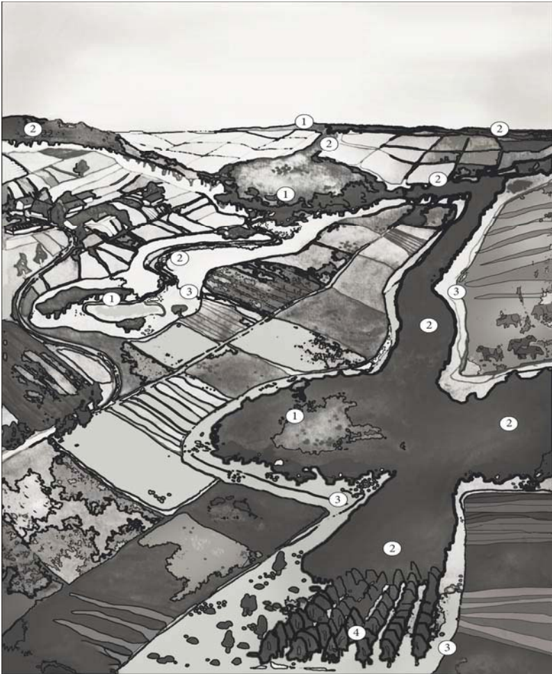
Рис. Д.6.1. Структурні елементи екологічної мережі: 1 – природне ядро; 2 – екологічний коридор; 3 – буферна зона; 4 – відновлювальна територія