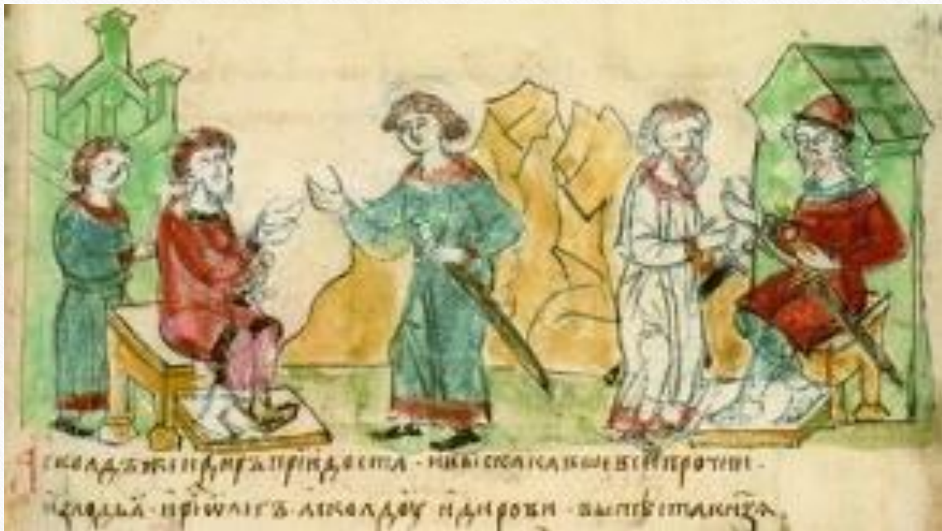
Аскольд і Дір. Радзивіловський літопис