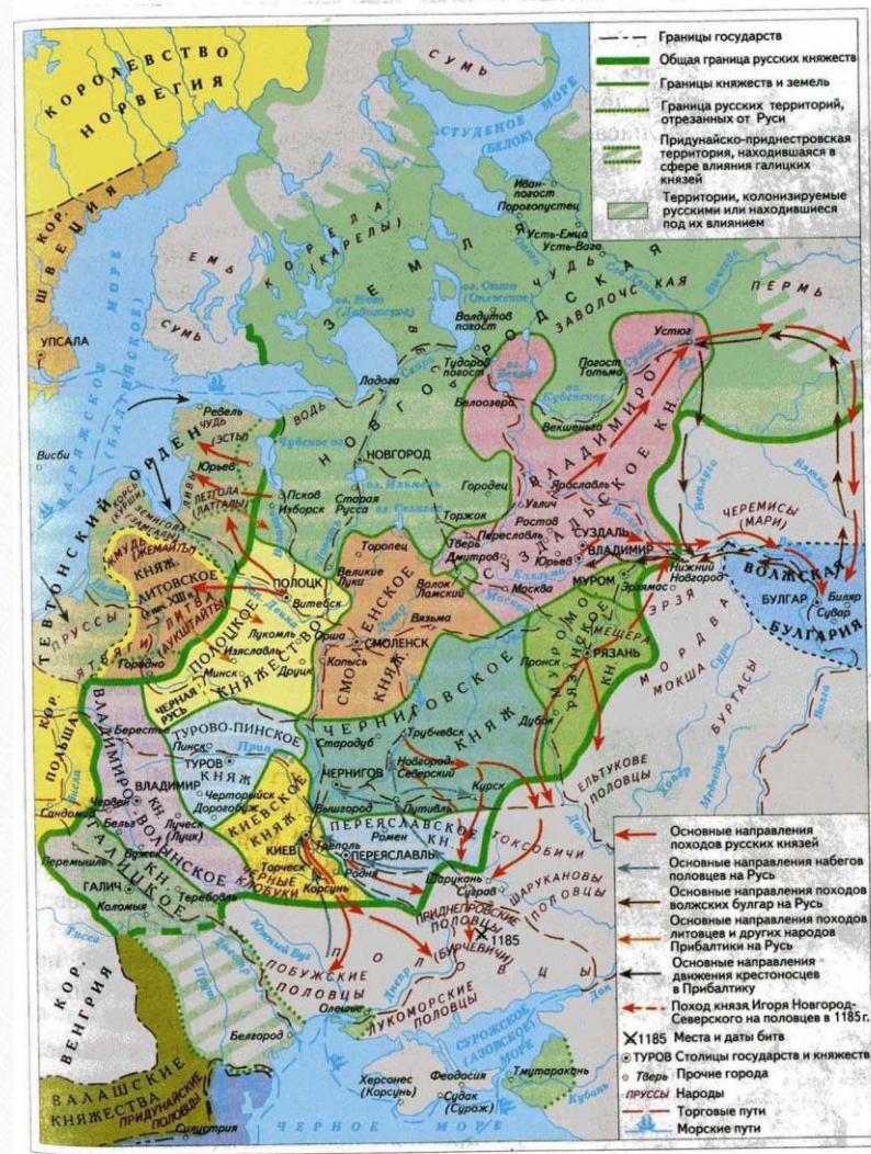
РУССКИЕ ЗЕМЛИ В XII — НАЧАЛЕ XIII в.