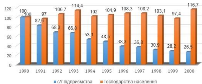
Індекс продукції сільського господарства за категоріями господарств (1990=100%)