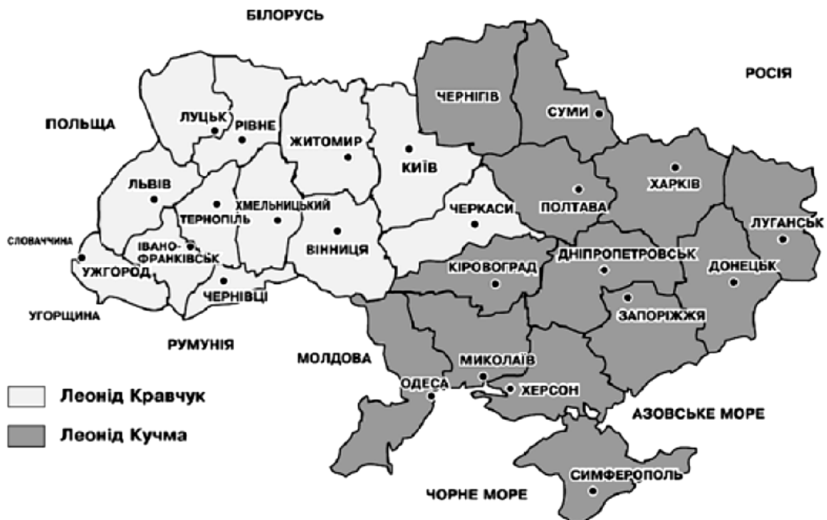
Переможці по областях на президентських виборах 1994 р. [3, с.88].

Мажоритарна основа парламентських виборів 1994 р. створила певні інституційні перешкоди заповненню складу парламенту і його партійно-ідеологічному структуруванню. Попри значний електоральний успіх безпартійних кандидатів, географія виборчих преференцій засвідчила, що кандидати від лівих політичних сил опиралися на підтримку виборців Сходу, Центру і Півдня, тоді як у Західному регіоні перевагу отримали кандидати від правих і правоцентристських партій.