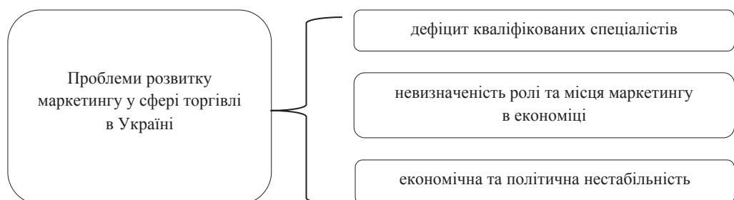
Рис. 2. Сучасні проблеми розвитку маркетингу в Україні [2]

Сучасний розвиток товарного ринку в Україні відбувається на фоні кризи економіки, а також політичної нестабільності. Це призводить до виникнення ряду проблем, пов'язаних з використанням комплексу маркетингу в системі дистрибуційних підприємств (рис. 2).